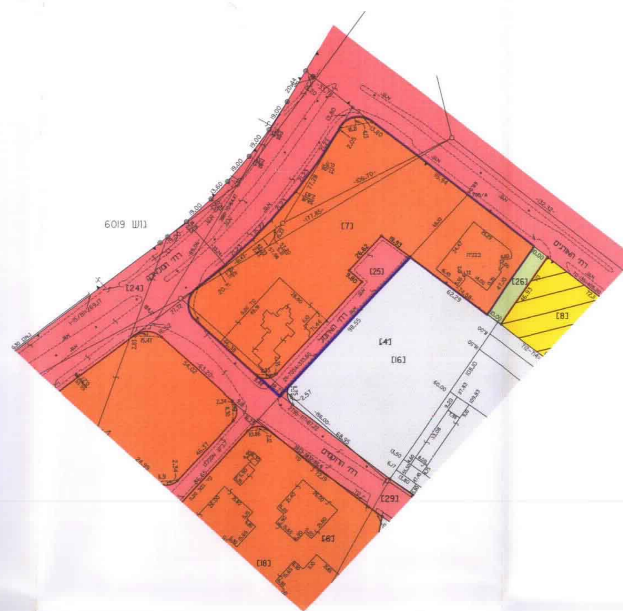
מצב קיים קני"מ 1:1250