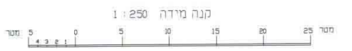
קנה מידה : 1:250