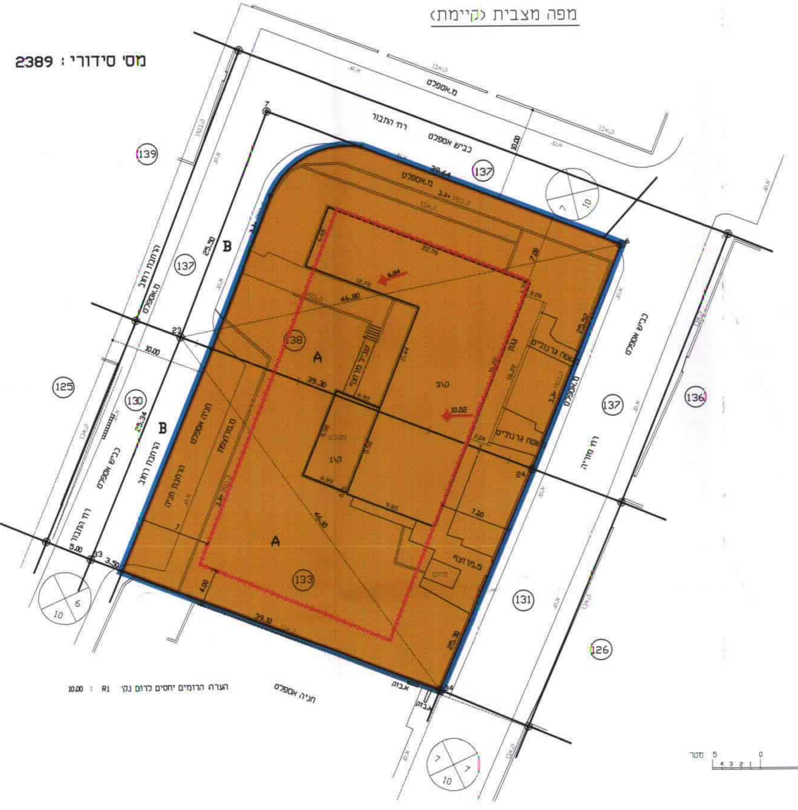
מפה מצבית (קיימת)