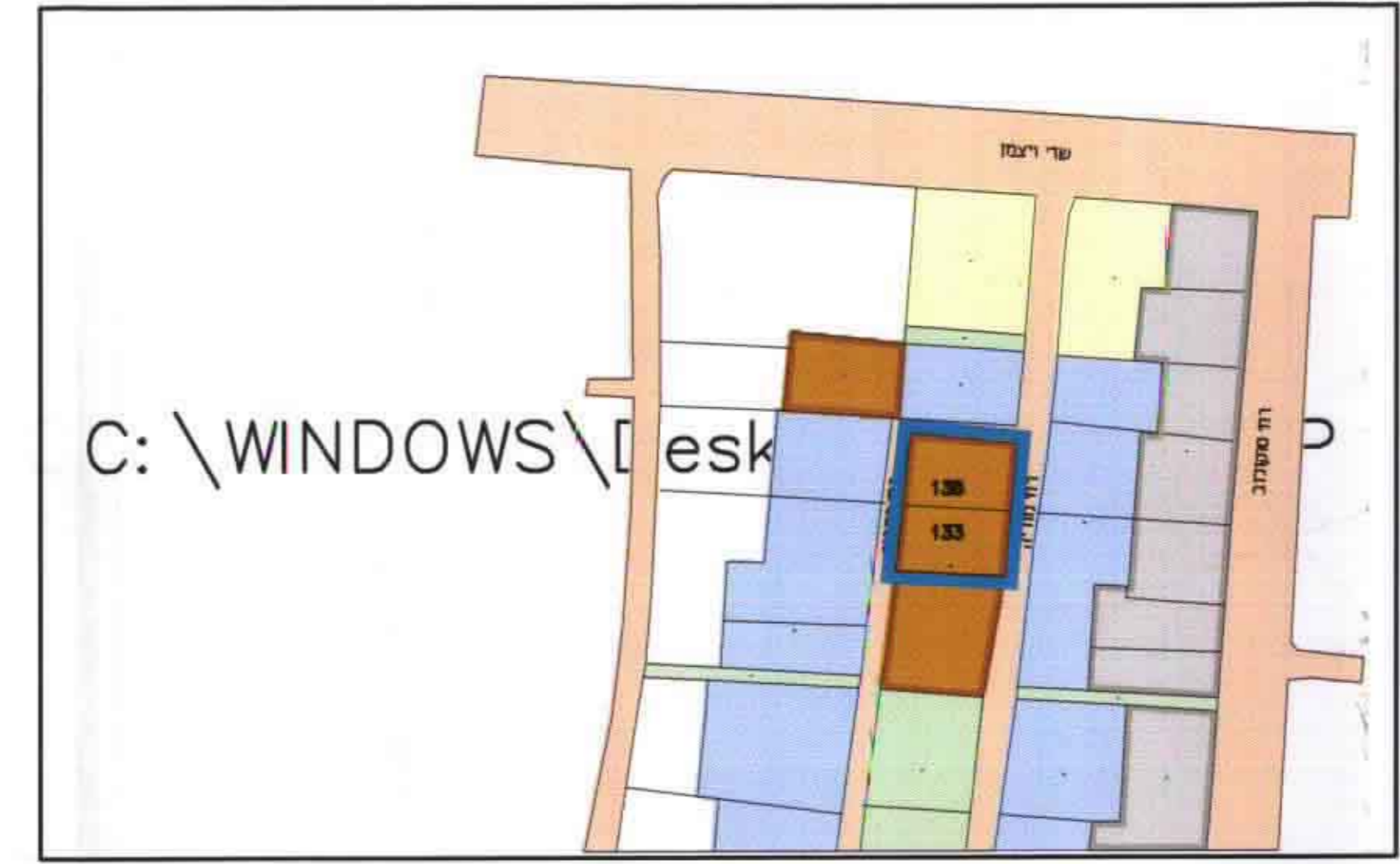
חרשים סביבה 1:2500

העדה מקומית - רמת השרון התכנית עברה בדיקה תכנית מס' 17/2002 ומצאה רשימה כיוון עריכת תוכנית תאריך : 17/2/02