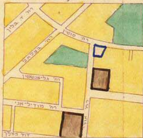
תרשים המקום 1:5000