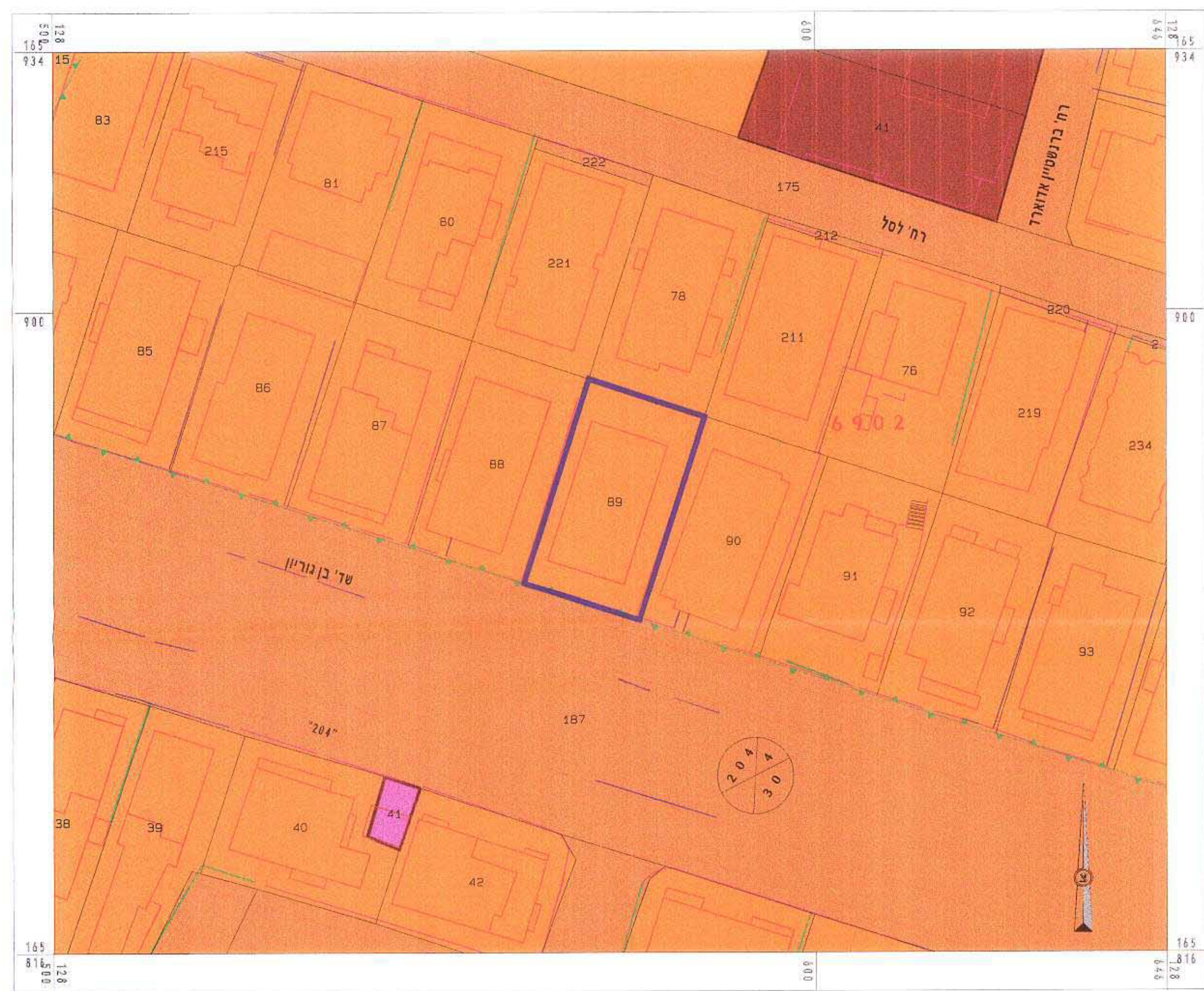
תכנית מצב קיים קני"מ 1:500