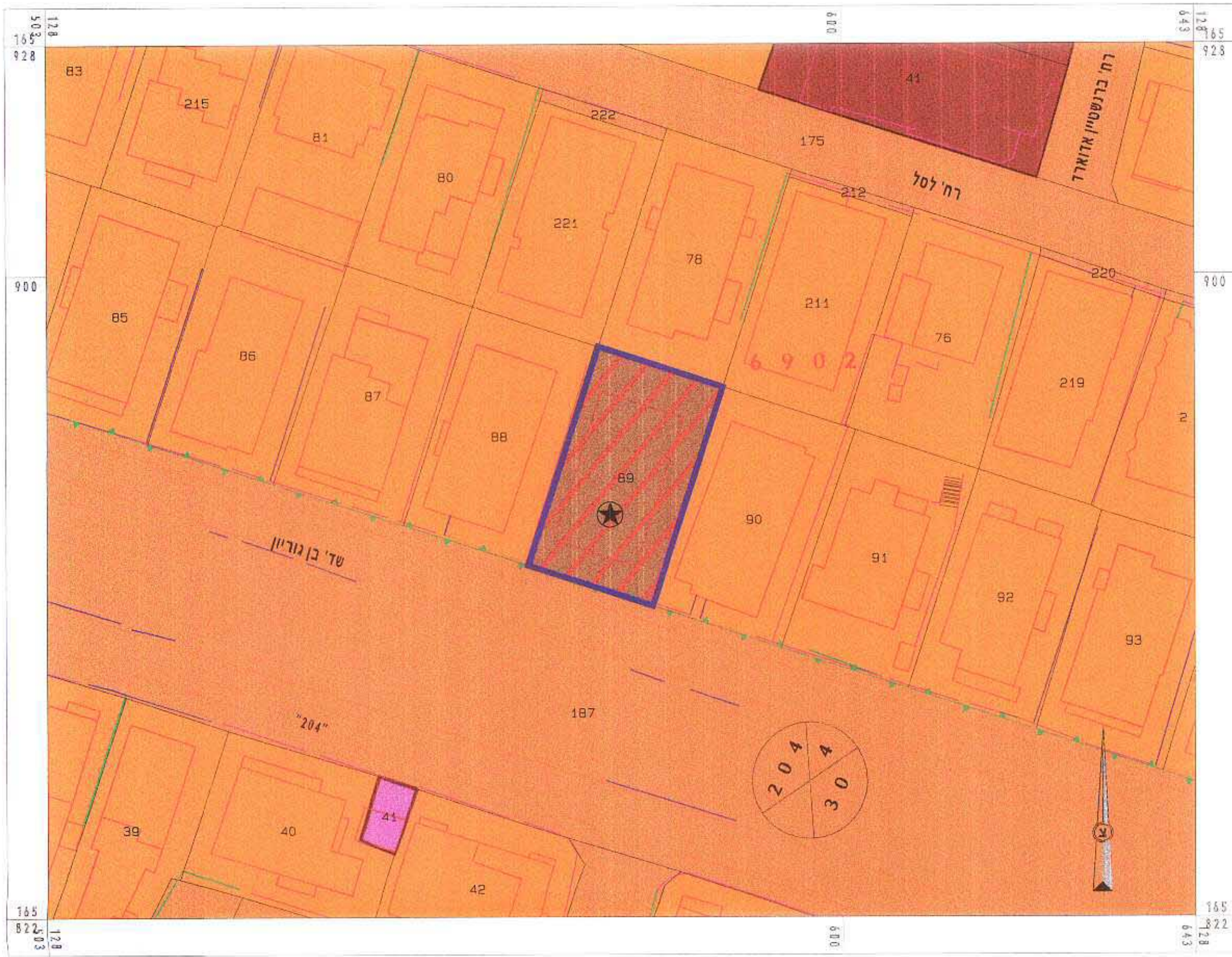
תכנית מצב מוצע קני"מ 1:500