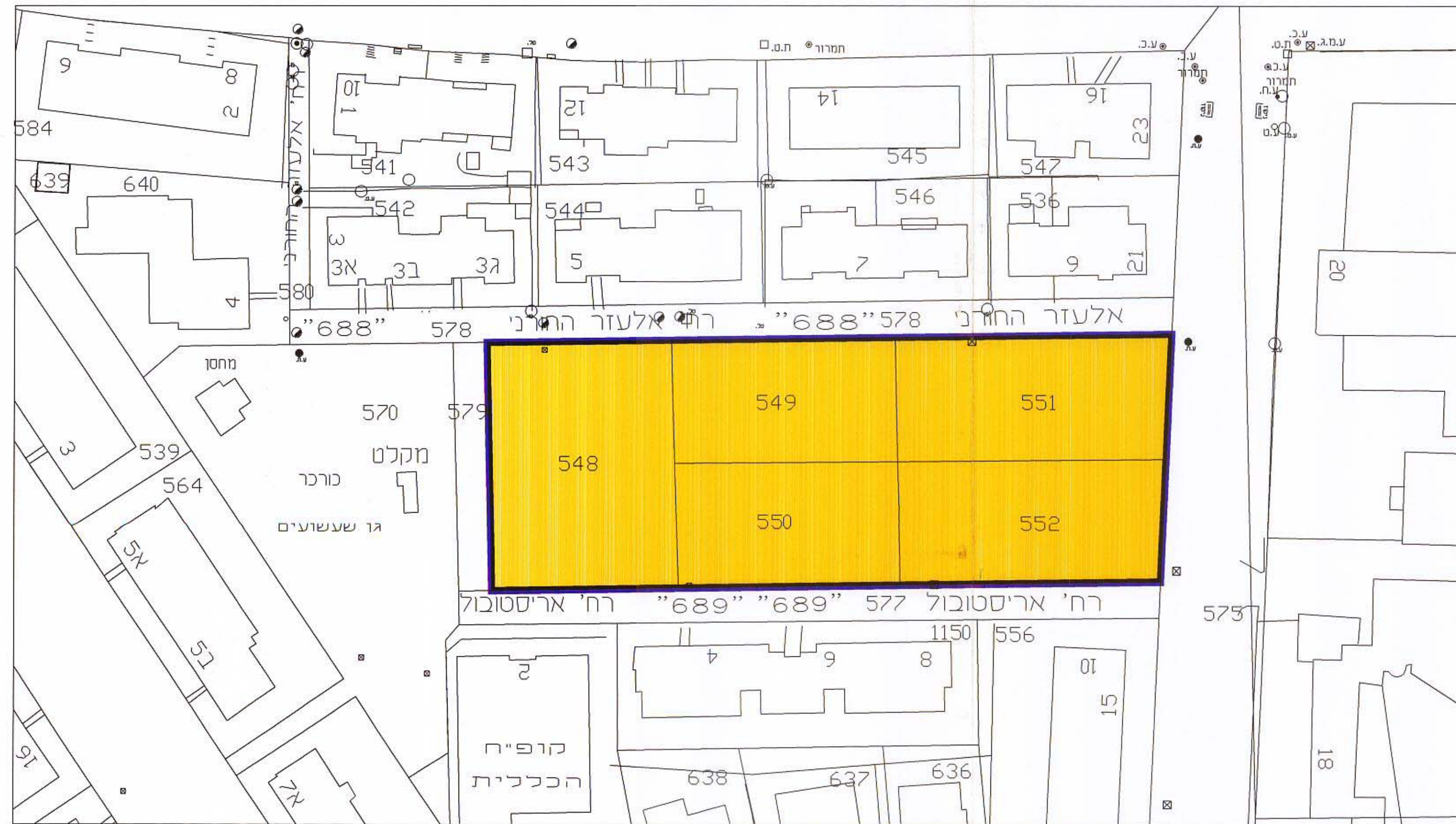
תכנית מצב קיים קנ"מ 1:500

שינוי מס' 1 לשנת 1997 של תכנית מתאר מס' 50 שינוי מס' 1 לשנת 1997 של תכנית מתאר ג' - גנות שינוי מס' 1 לשנת 1997 של תכנית מפורטת 478