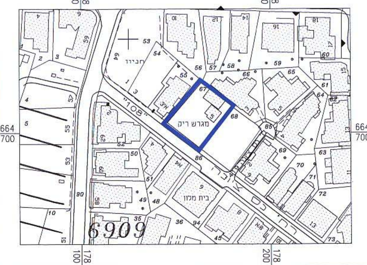
תרשים סביבה ק.מ. 1:250