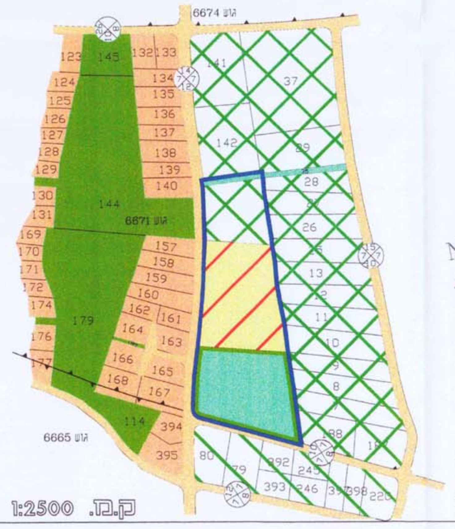
מ.ב. 1:2500 תרשים הסביבה

תחילת תכנון: 27.5.03 תחילת עבוד התכנית: 27.5.03 תחילת עבוד השרטוט: 27.5.03 תחילת יום התכנית: 27.5.03 תחילת עבוד הקמת: 27.5.03 תחילת עבוד השלמת: 27.5.03 The Planning Board American International School 7110 Shmaryahu St. P.O. Box 9005 Kfar Shmaryahu, Israel 4690 הגוף המוסמך לתכנון: מועצה מקומית הרצליה תאריך: 27.5.03 חתום: [Signature]