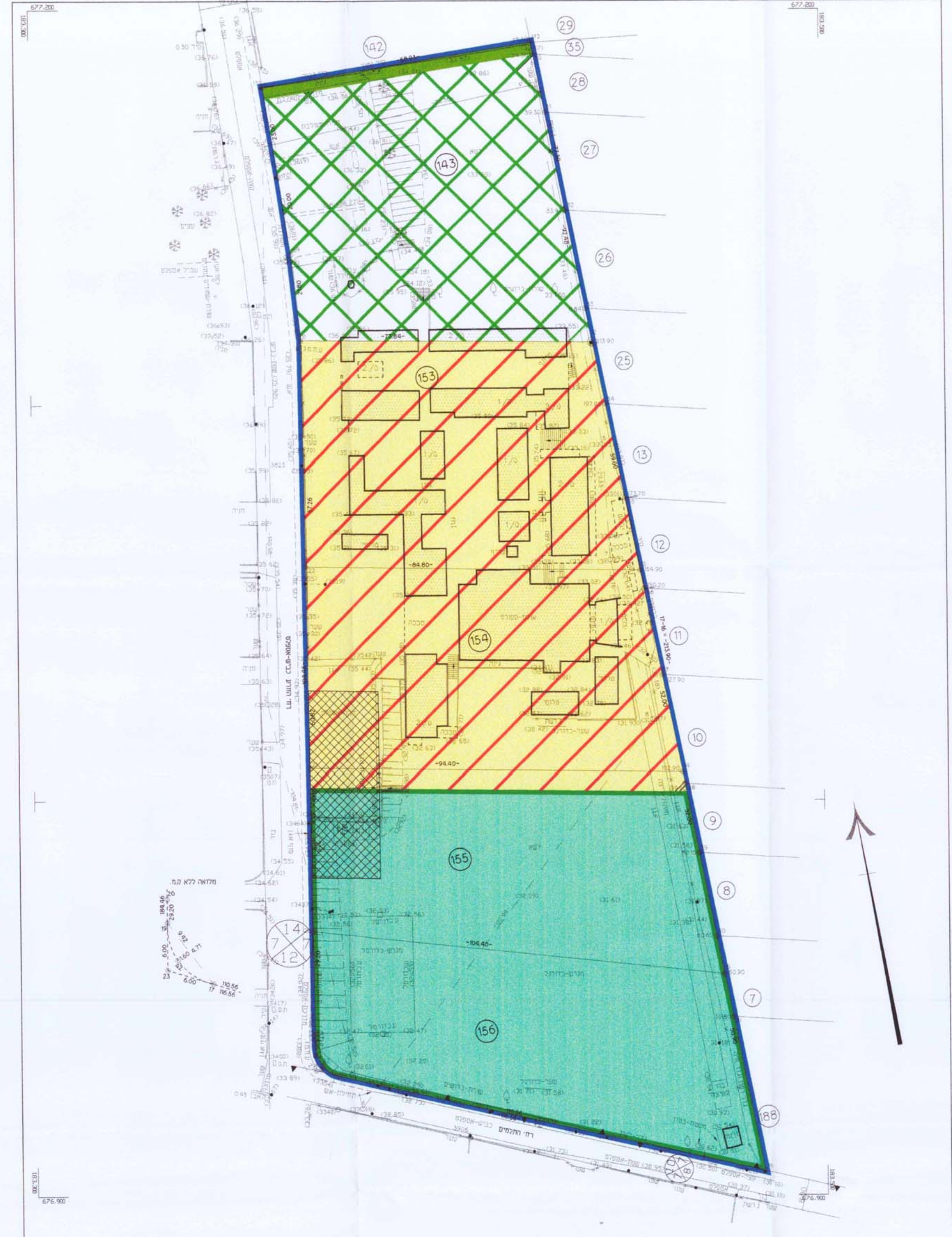
מ.ב. 1:500 מצב קיים