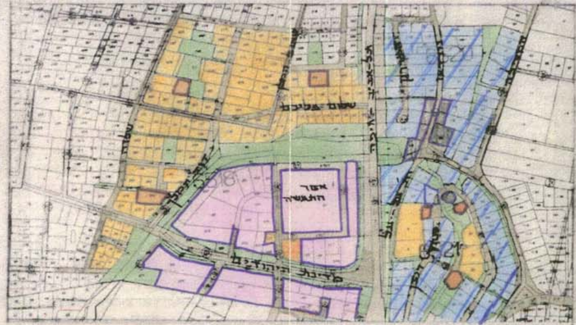
מרחב תכנון 1:5000