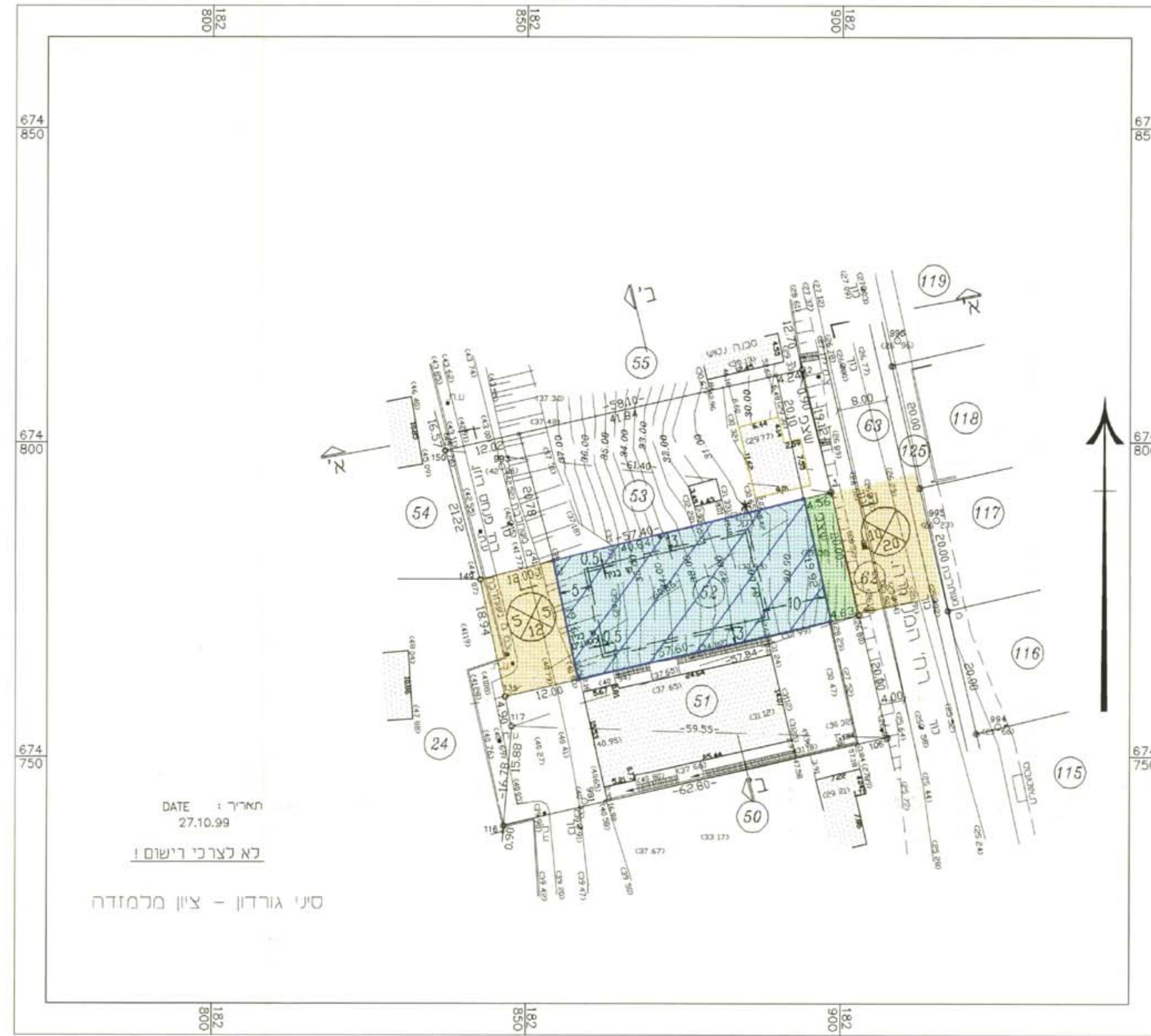
תכנית מצב מוצע ק.מ. 1:500