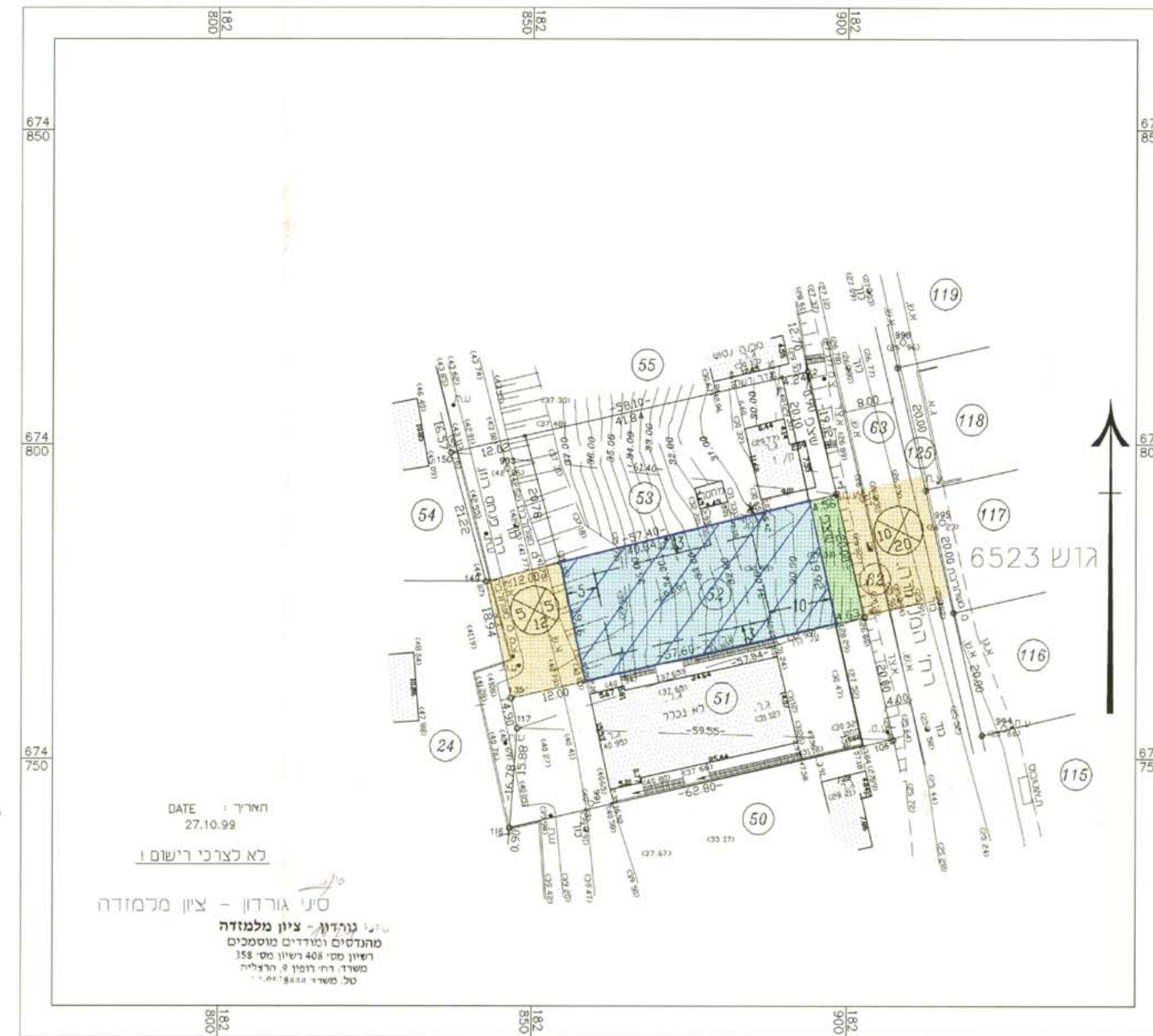
תכנית מצב קיים ק.מ. 1:500