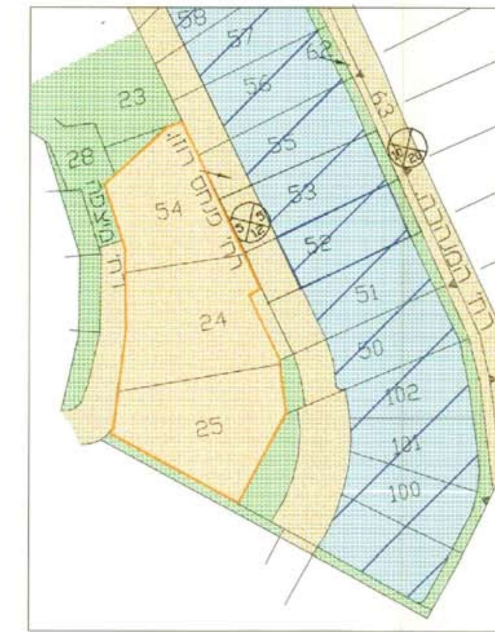
תכנית הטריברה ק.מ. 1:1250

מחוז תל-אביב מרחב תכנון מקומי הרצליה תכנית מס' הר/מק\2033 שני נחנות המארז 253 א' והנחית הר/1597.