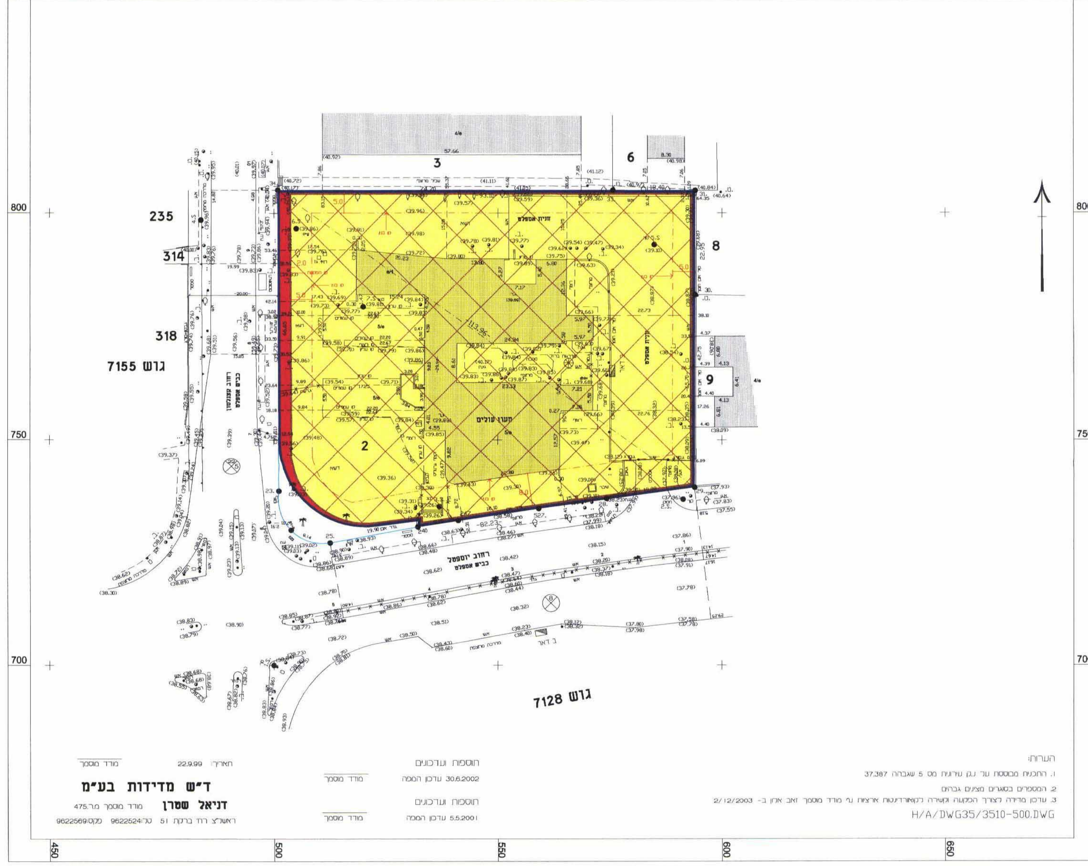
מצב קיים 1:500

השרות: 1. רחובות מסמכת עד גן שרונה 5 שארית 37.387 2. הסמכים במסגרת פננים גבולות 3. עובד מורה בצורך הכמטה וסדרה לשיאודיסט ארצות נר מודר מסמך זמין ארון ב- 2/12/2003 H/A/DWG35/3510-500.DWG חוספה ועדכונים 30.6.2002 עדכן הסכה חוספה ועדכונים 5.5.2001 עדכן הסכה חאיר: 22.9.99 מודר מסמך ד"ש מדידות בע"מ דניאל שטרן מודר מסמך 475 מר 9622569070 9622524701 רישא"צ רור ברקת ו1