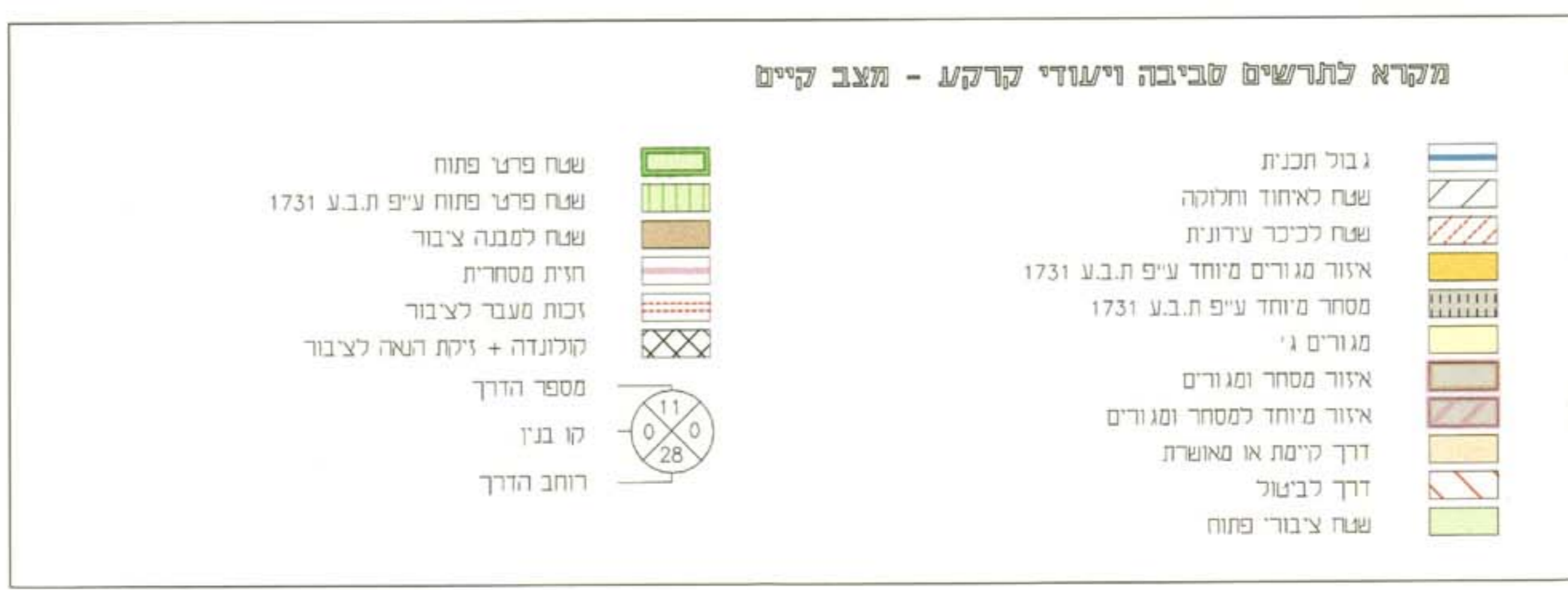
תרשים סביבה ויעודי קרקע - מצב קיים 1:1,250

תאריך: 8.5.01 חתימות: י"חאל קורין אדריכל