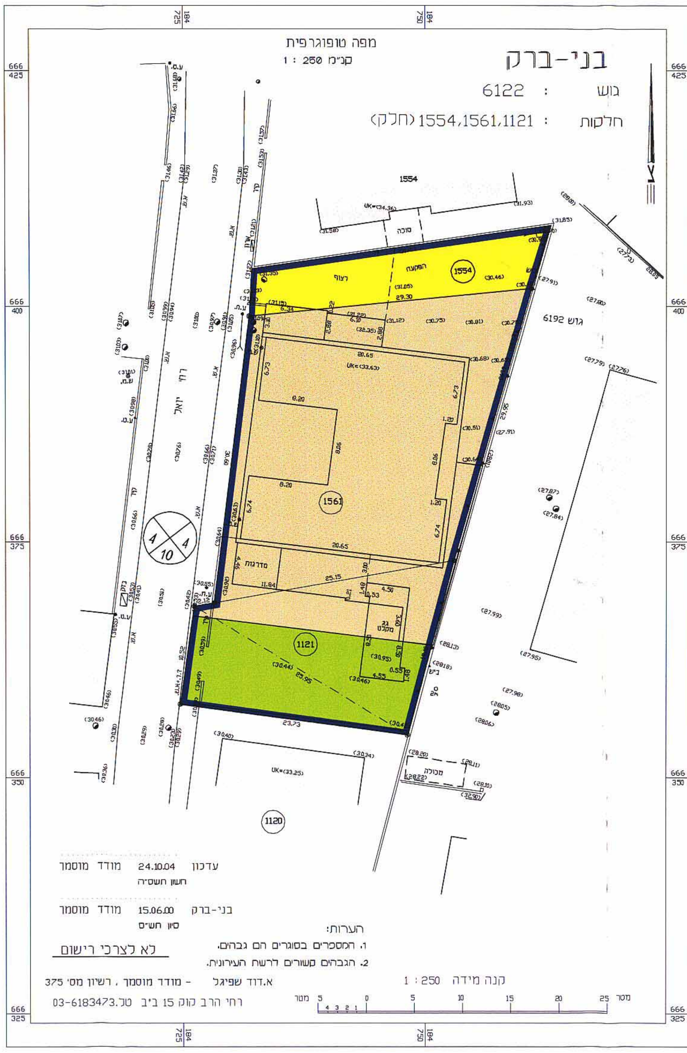
תרשים מגרש - מצב קיים קב"מ 1 : 250