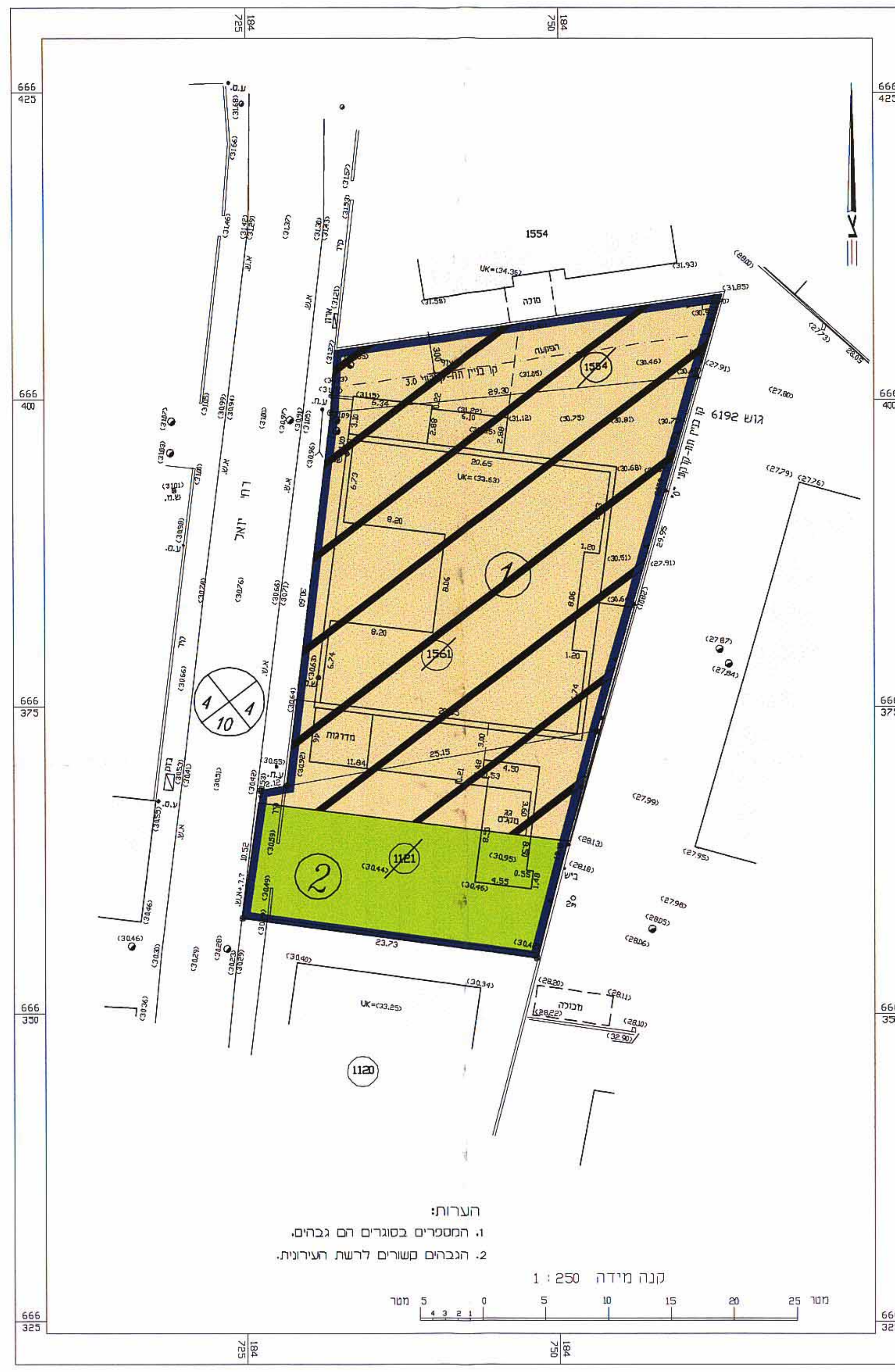
תרשים מגרש - מצב מוצע קב"מ 1 : 250