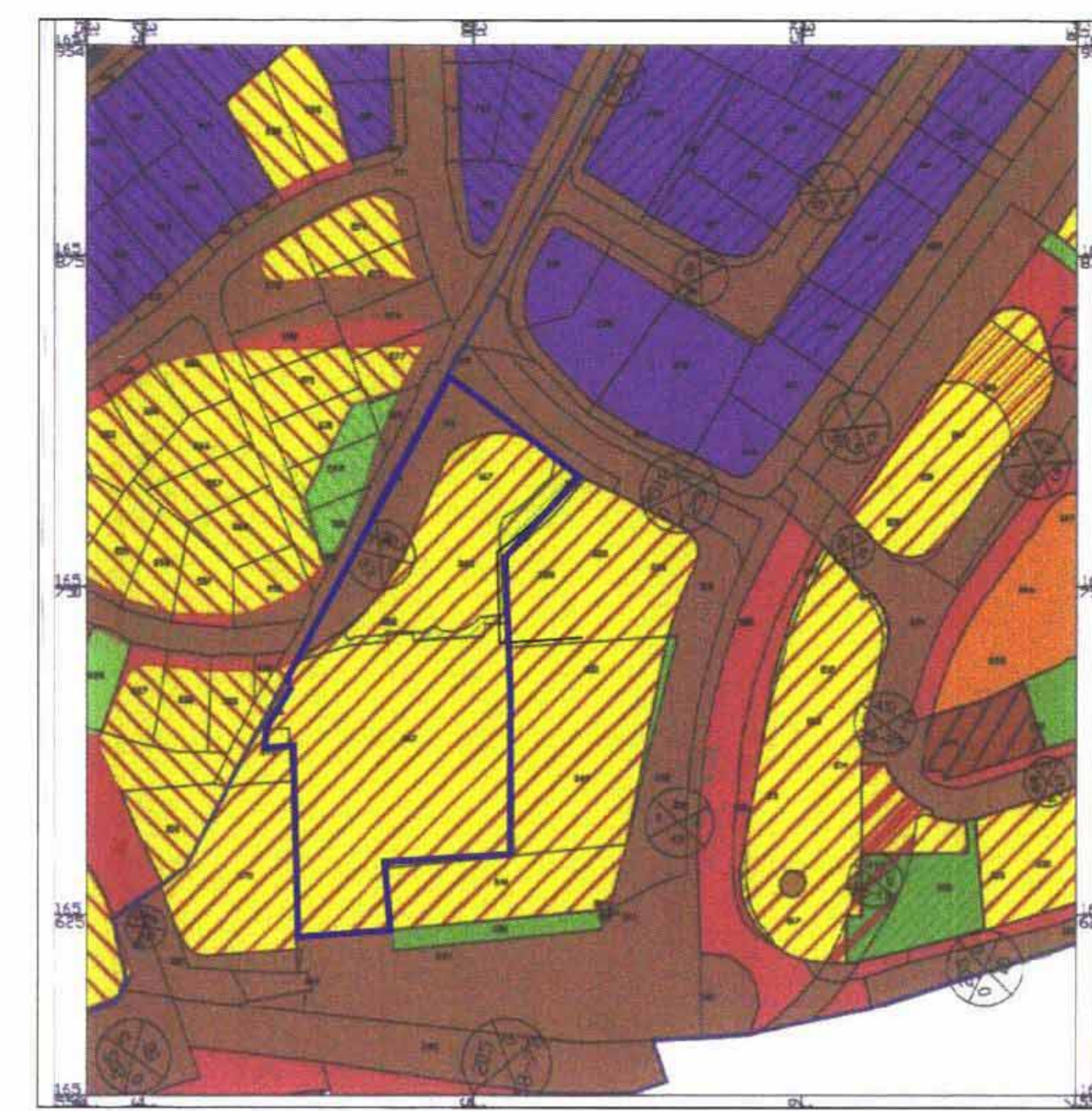
תשריט סביבה קנ"מ 1:2500