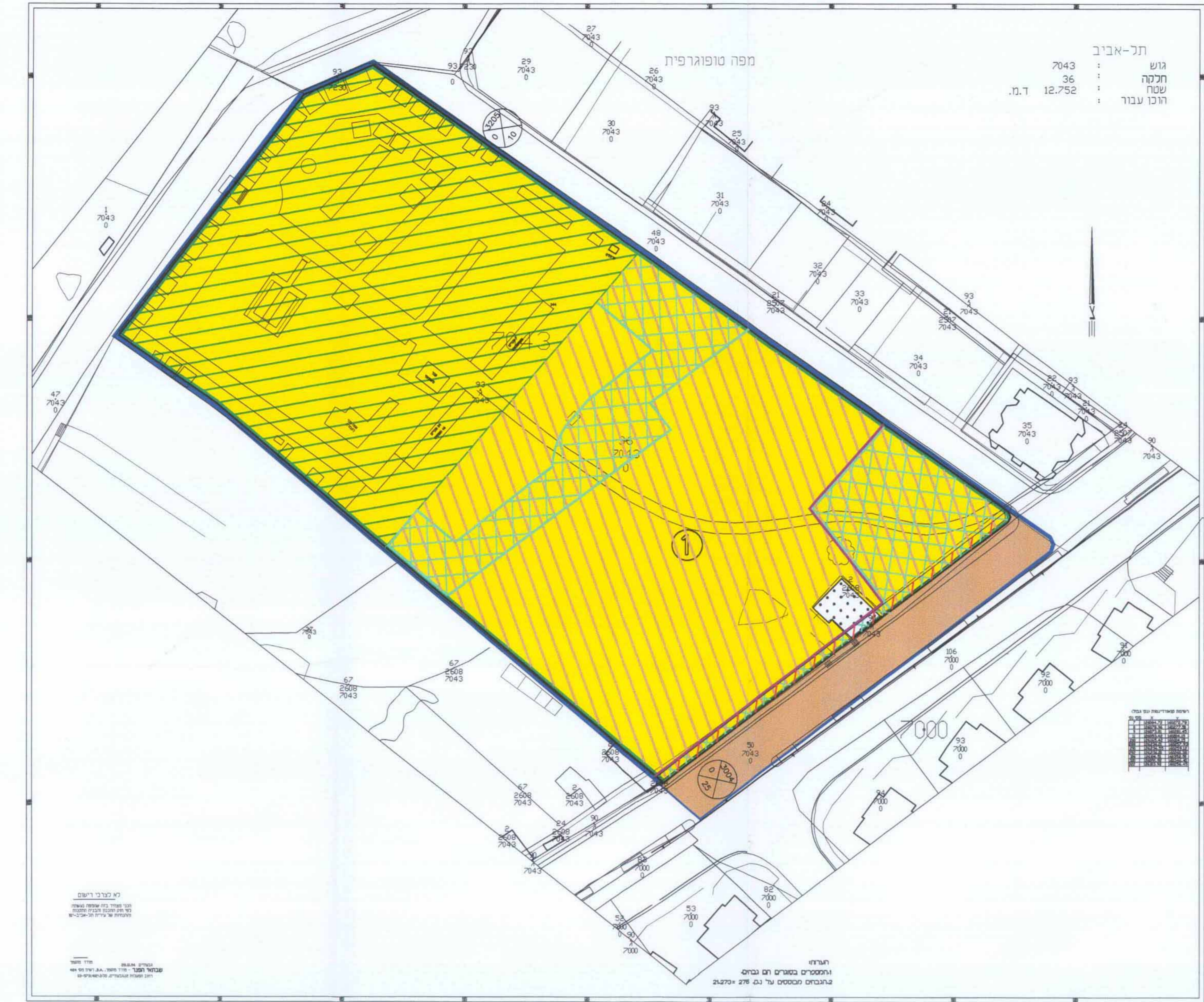
תכנית מצב מוצע ק"מ. 1 : 500