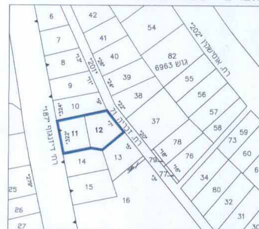
ק.נ.מ. - 1:1250