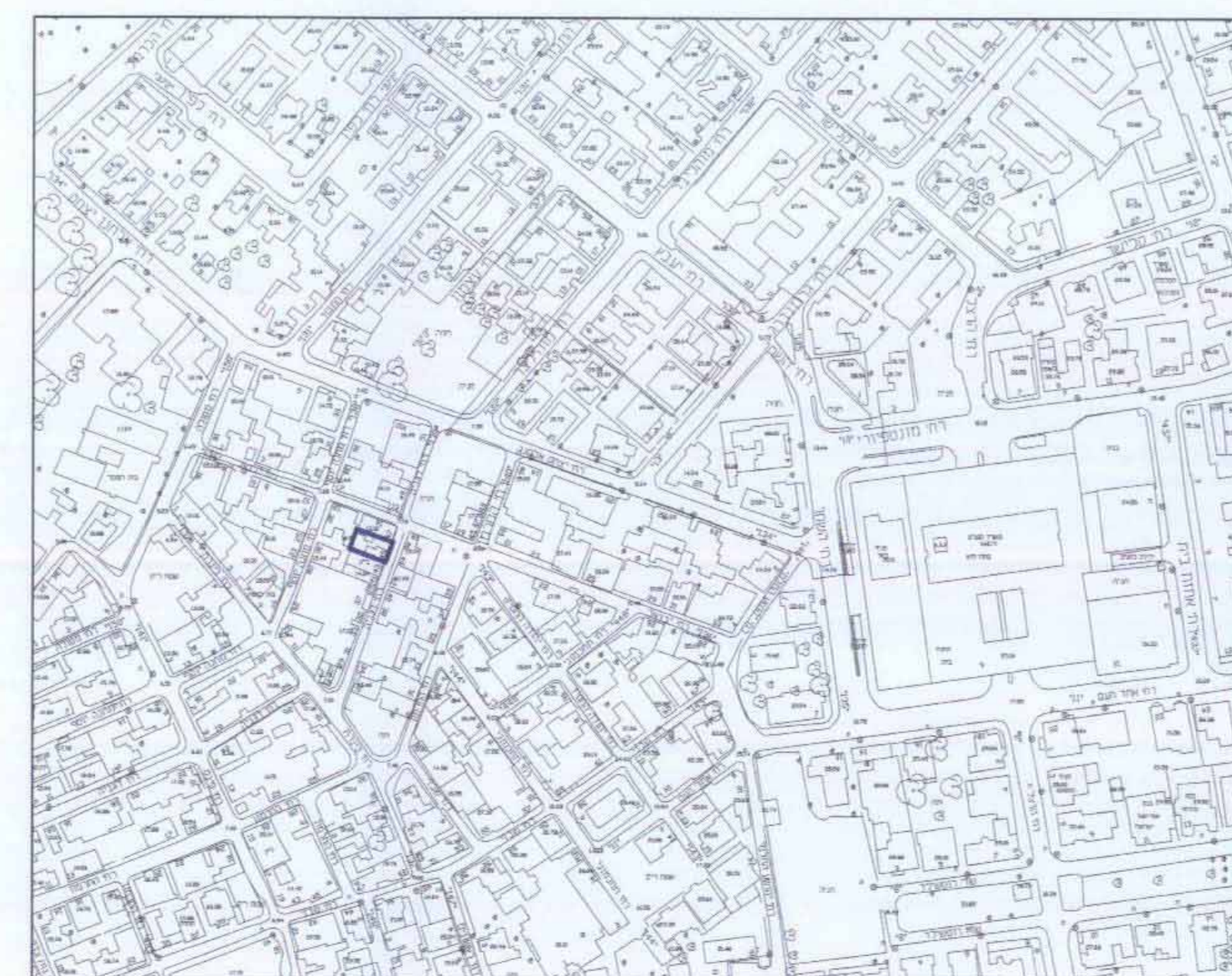
תרשים סביבה ק.מ. 1:2500