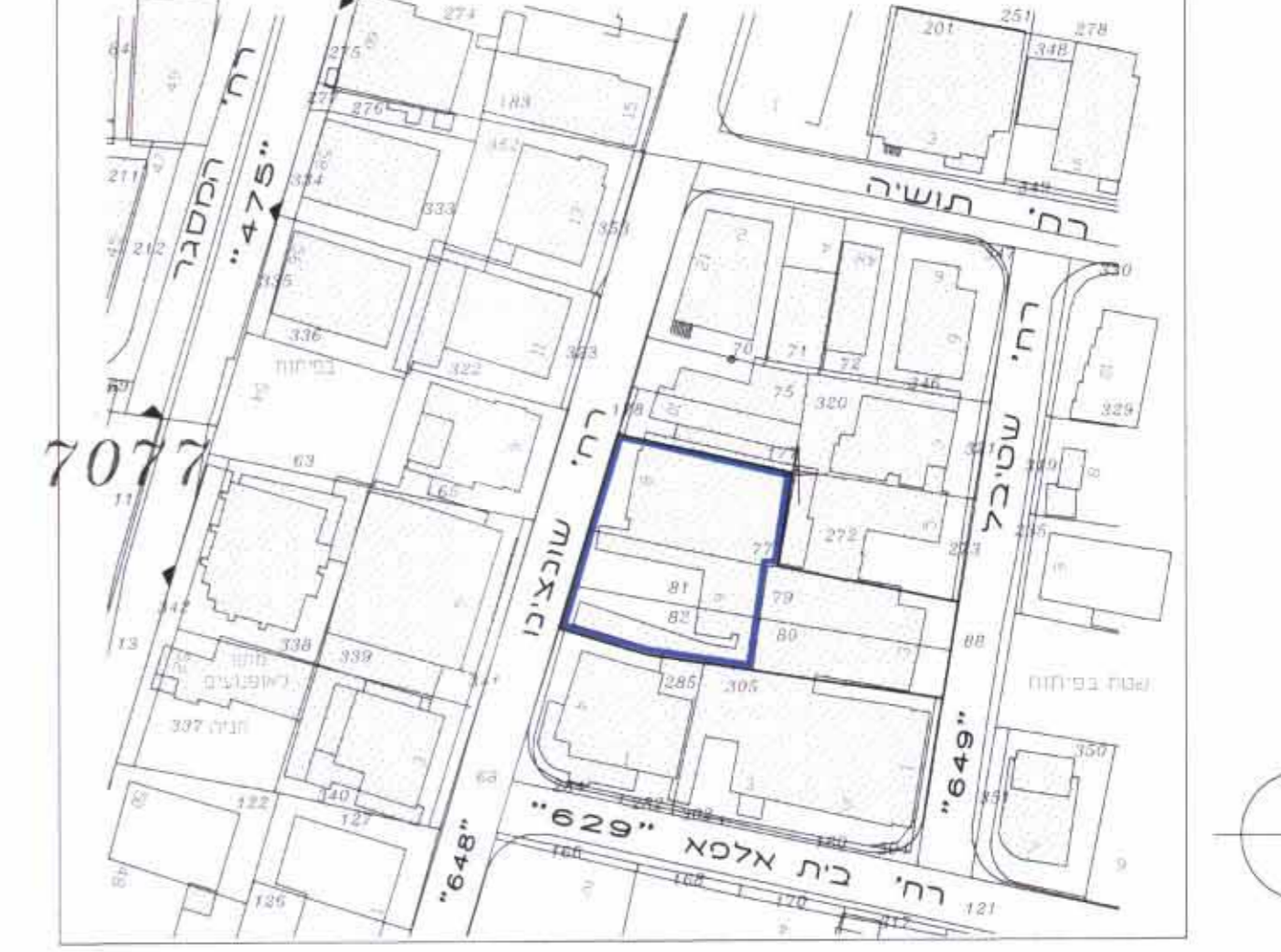
תשריט - מפת הסביבה 1:250