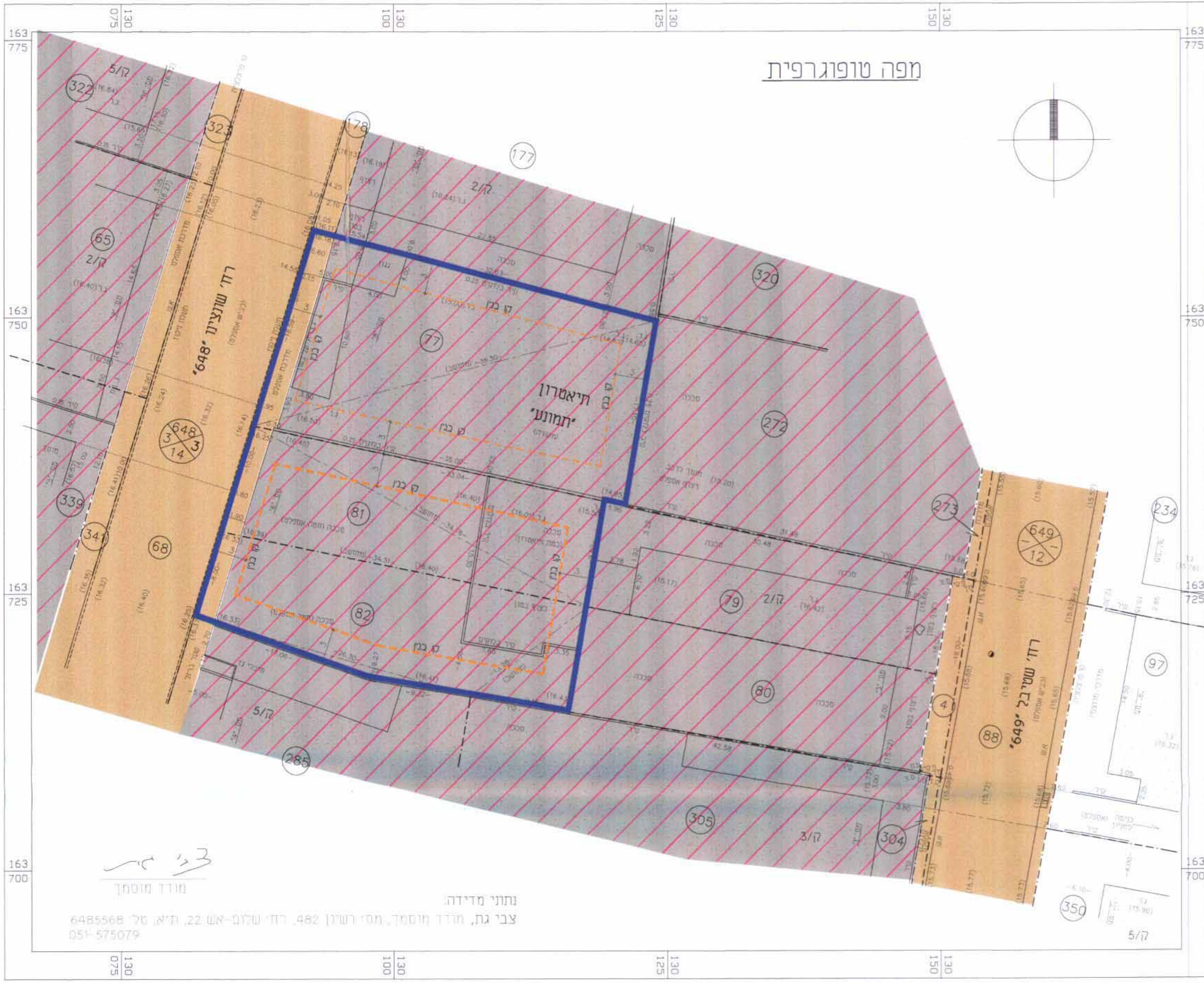
תכנית מצב קיים קנ"ח 250 : 1