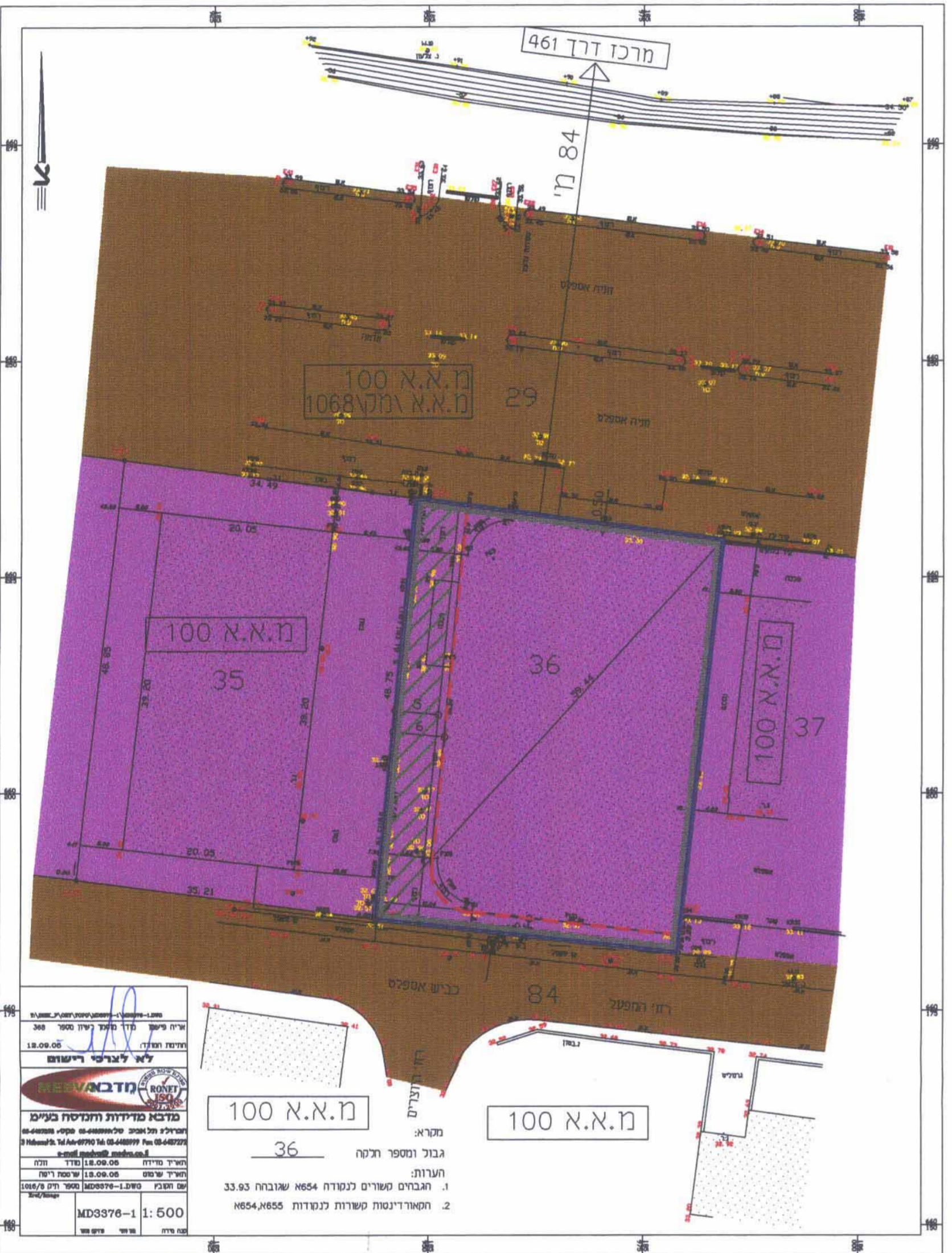
מפה טופוגרפית ק.מ. 1 : 500 מצב מוצע

מטרא: גבול ומספר חלקה 36 הערות: 1. תגובות משוריים נגודות 8654 שגובהן 33.93 2. התאוריינות קשורות נגודות 8654, 8655