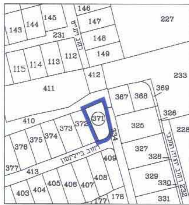
תרשים סביבה קנ"מ 12,500