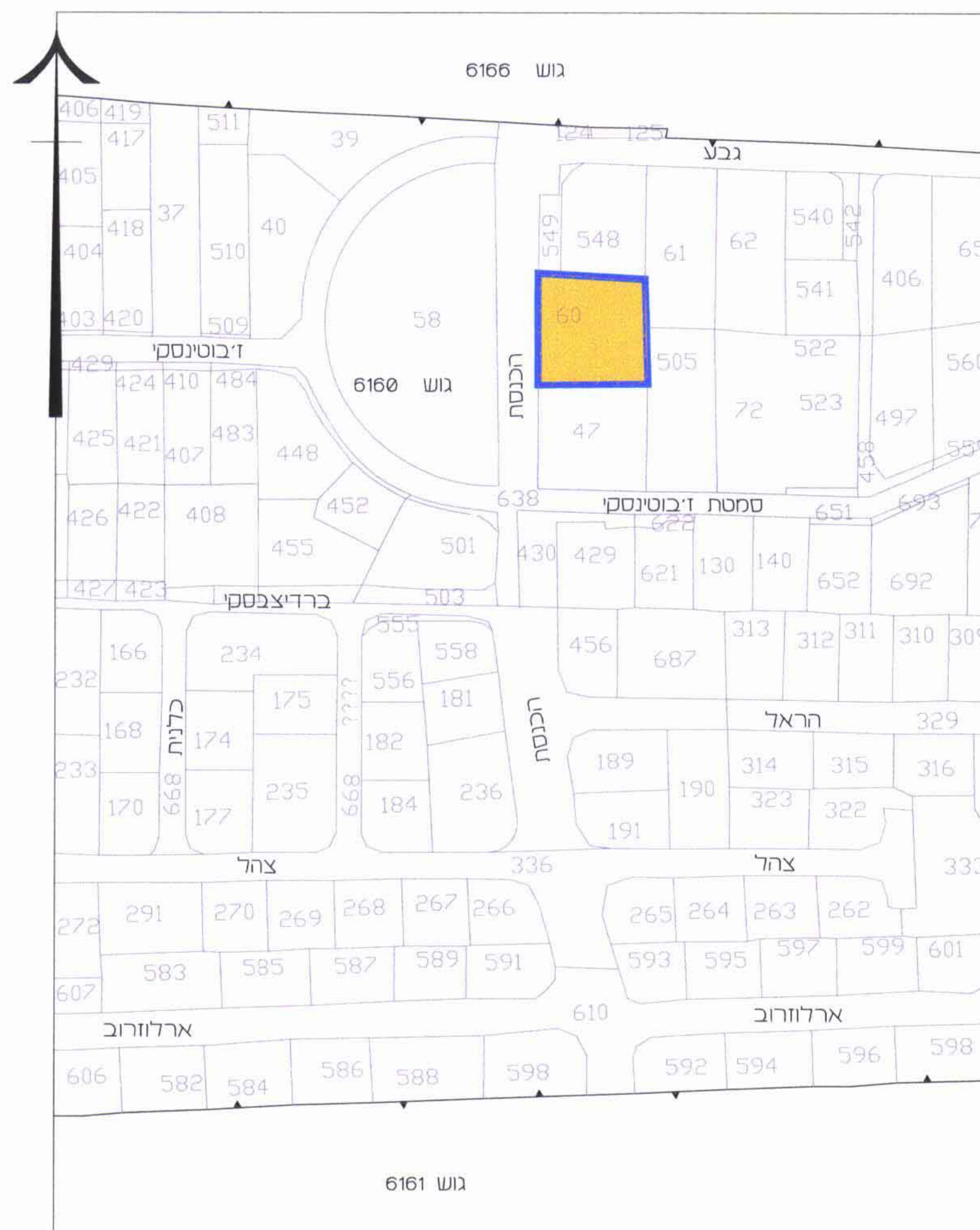
תרשים סביבה קנ"מ 1250