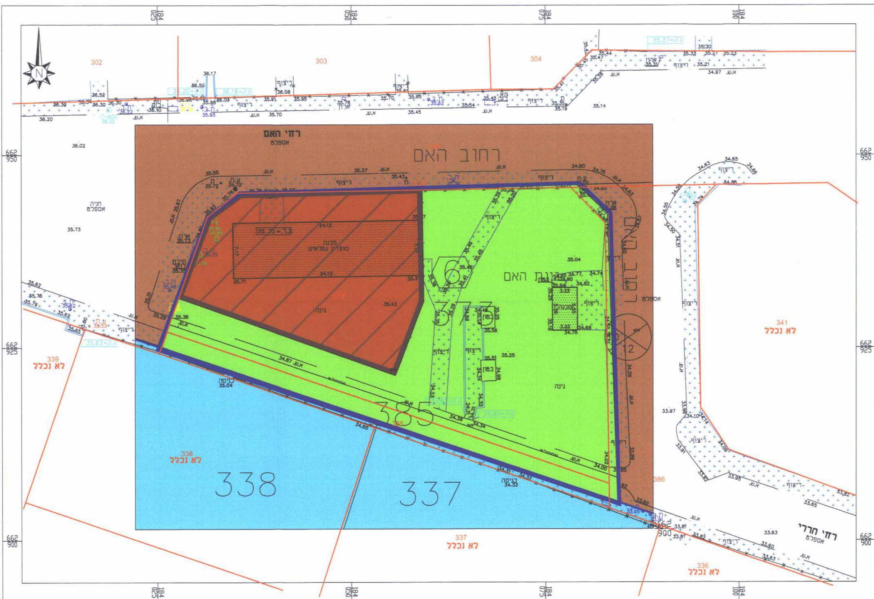
מצב מוצע 1:250