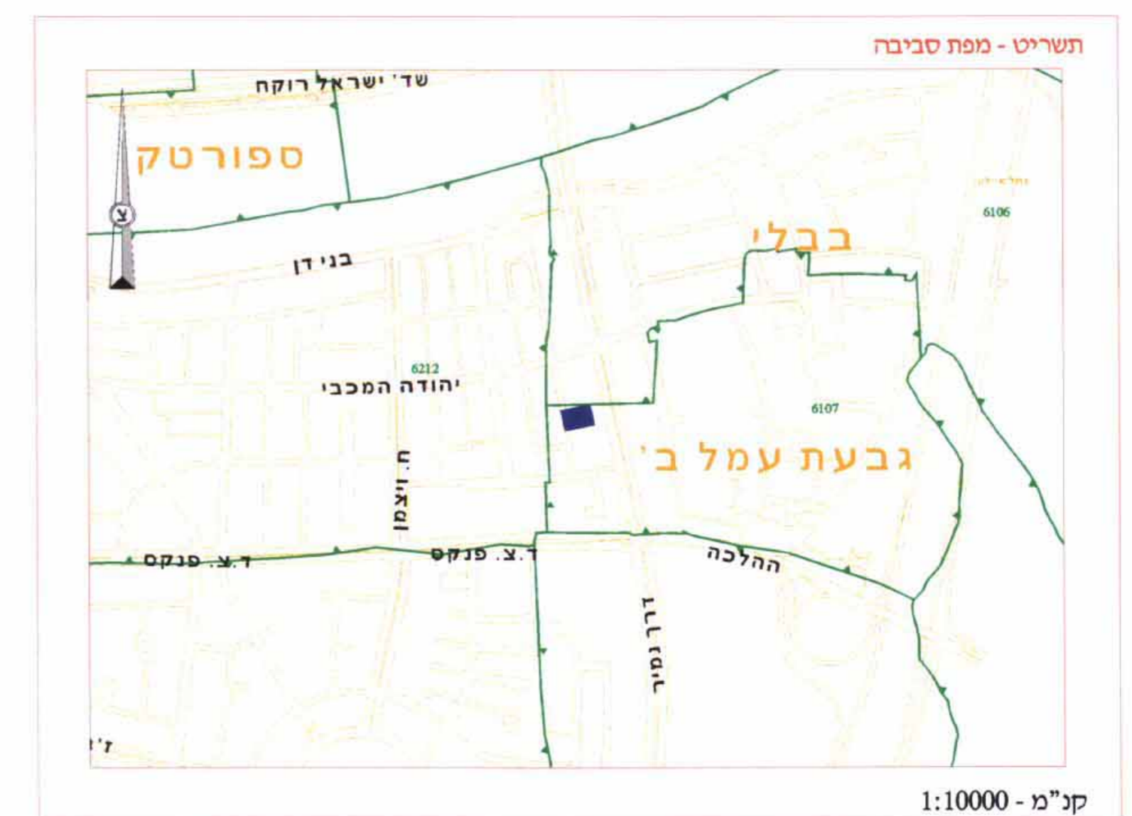
ק"מ - 1:10000