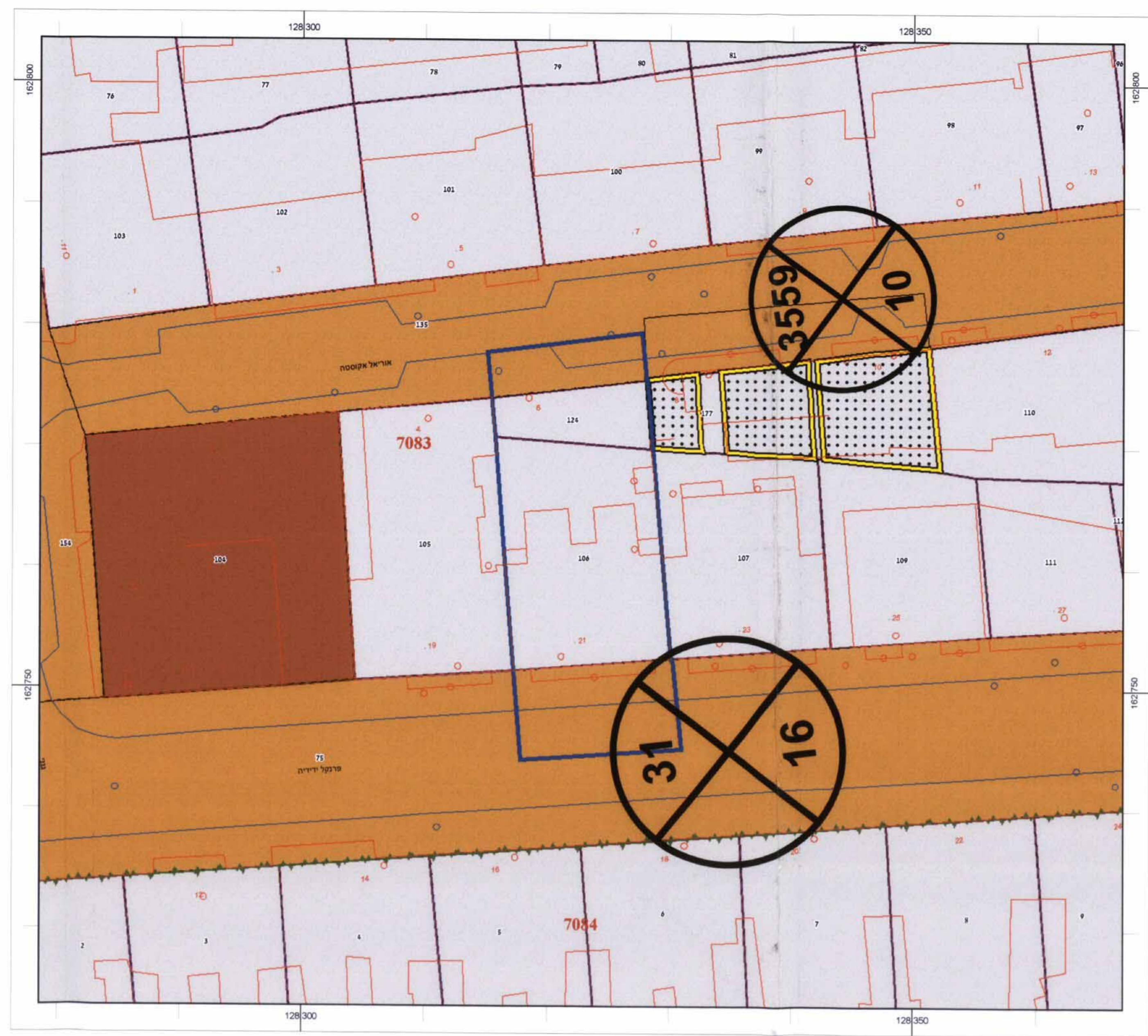
תוכנית מצב מאושר קנה מידה 1:250