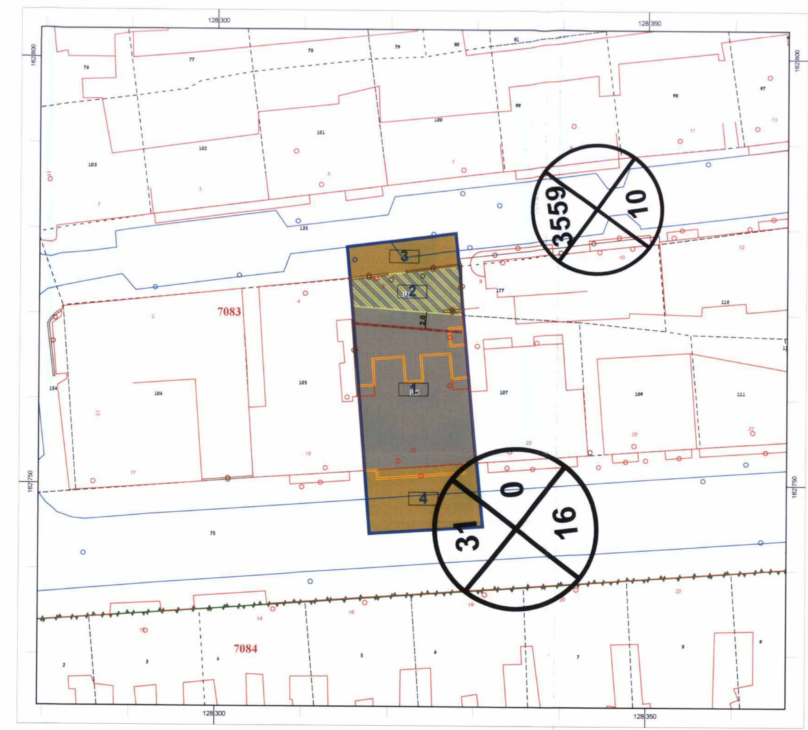
תוכנית מצב מוצע קנה מידה 1:250