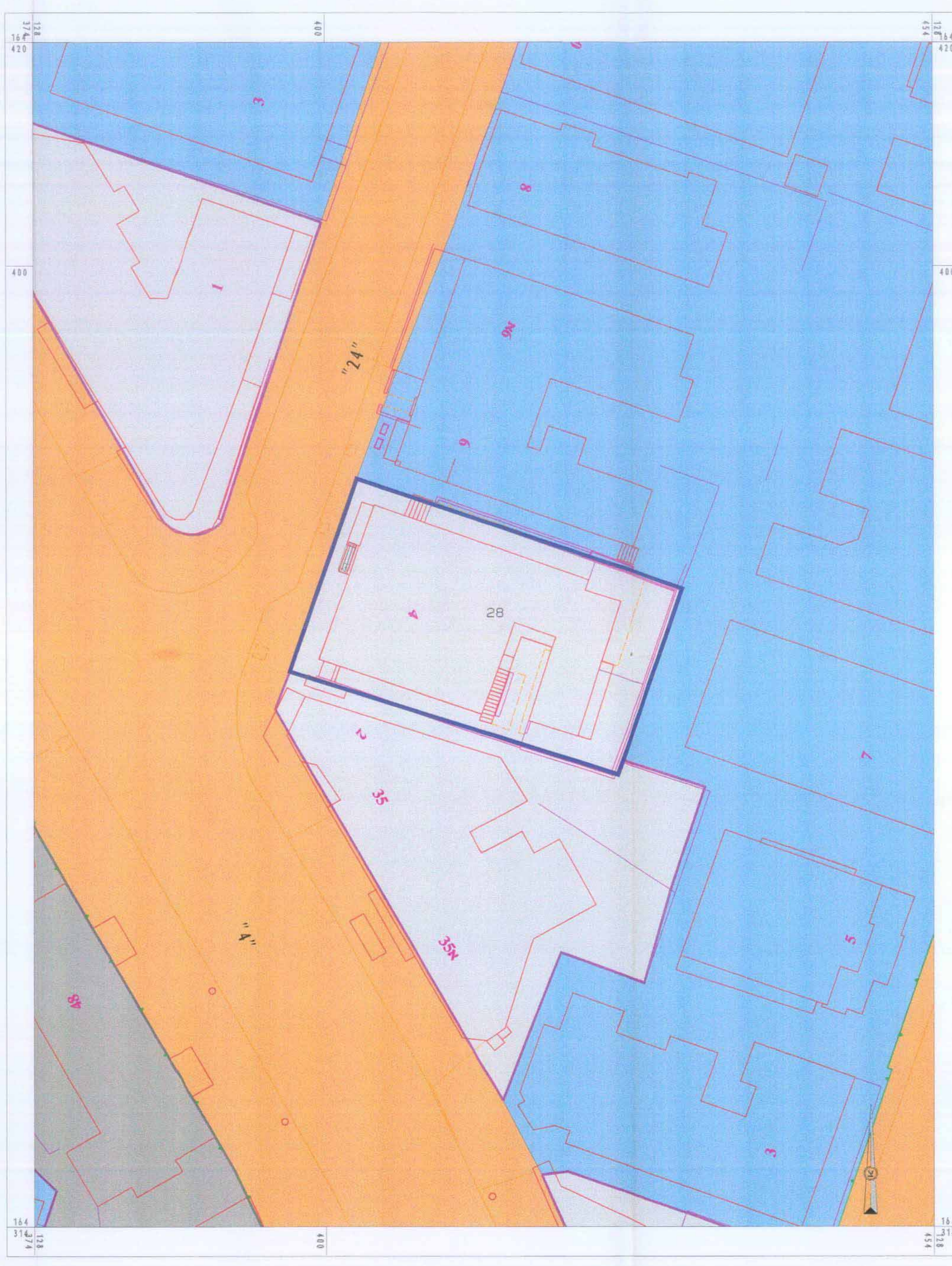
תכנית מצב קיים קי"מ 1:250

החברים הוכנו על סמך פסק הדין ע"פ ע"פ 307/05 ממ"ר 1000/05 של בית דין תל אביב-יפו, תשס"ה (10/05/05) ח"פ 7-07-05-1000-05 וולטר שיינקמן אדריכלים רישיון 36832