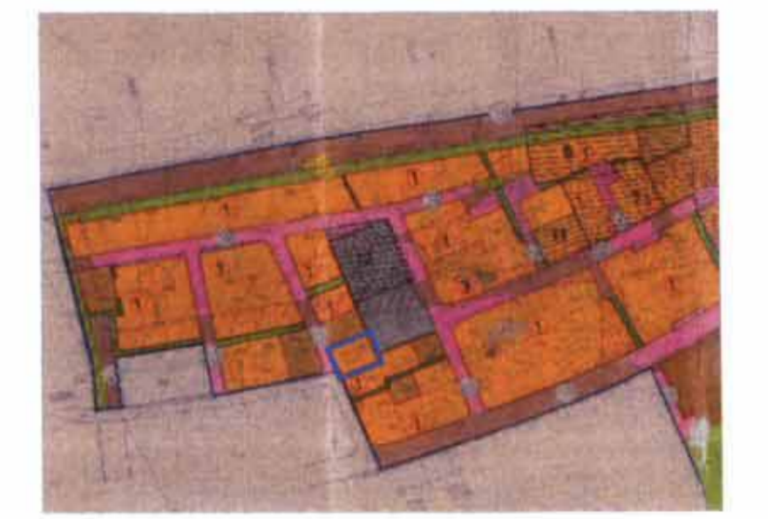
תרשים סביבה 1:5,000