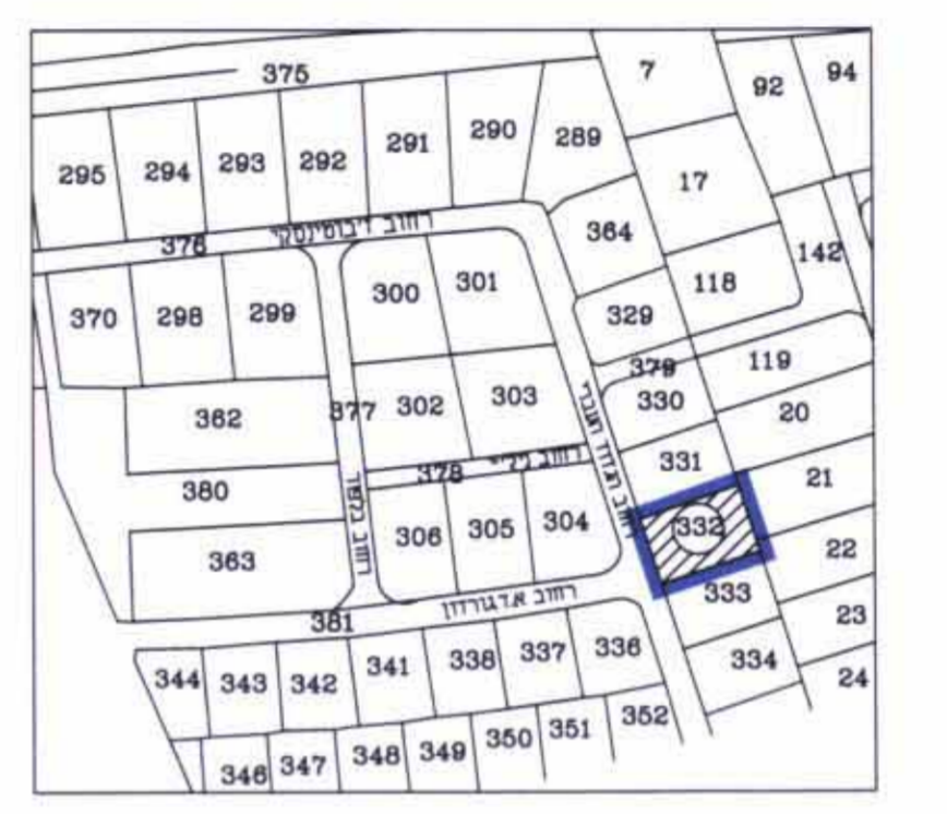
תרשים סביבה 1:2,500