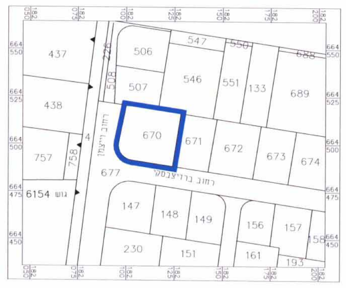
תרשים סביבה קני"מ 1:1250