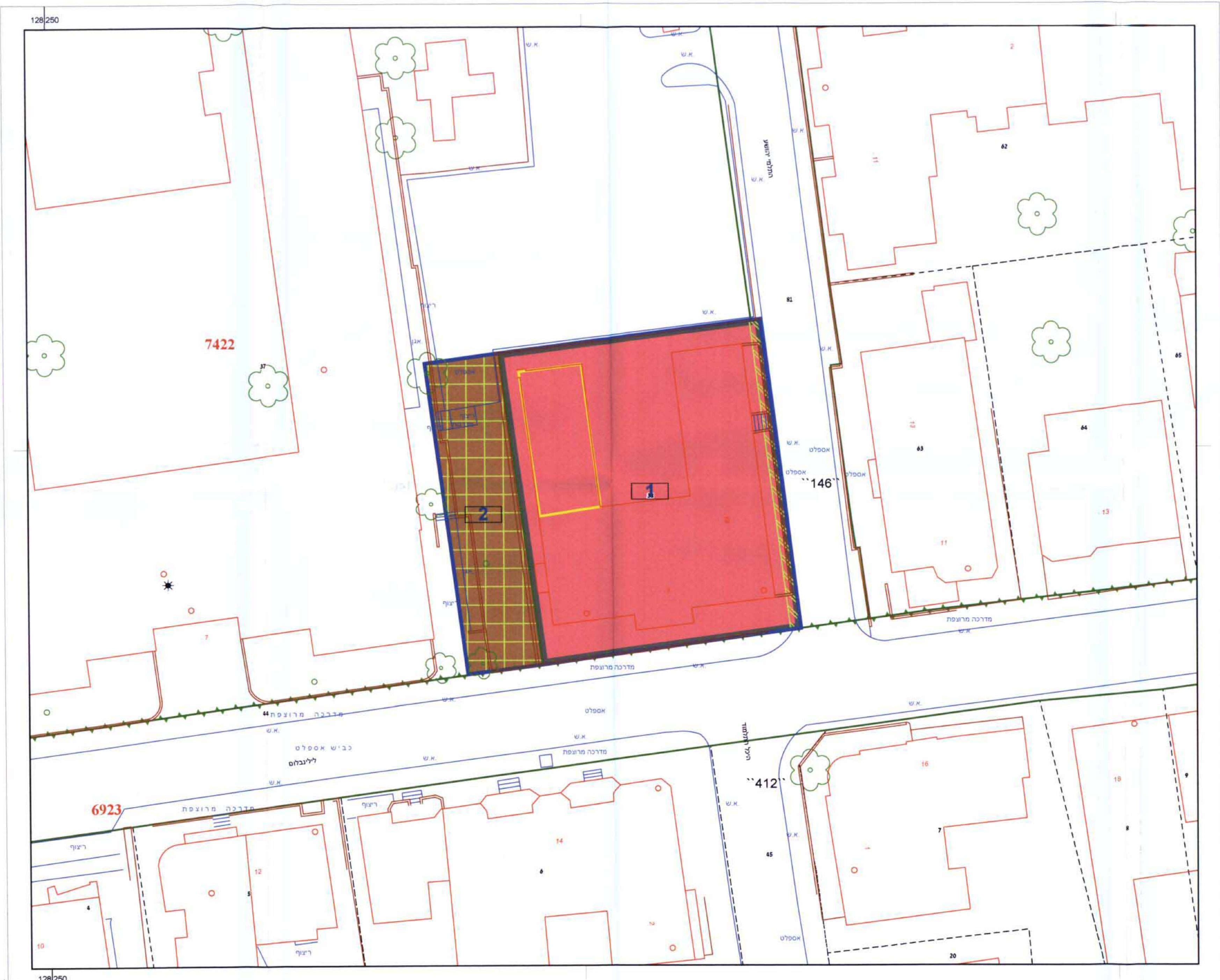
תוכנית מצב מוצע קנה מידה 1:250