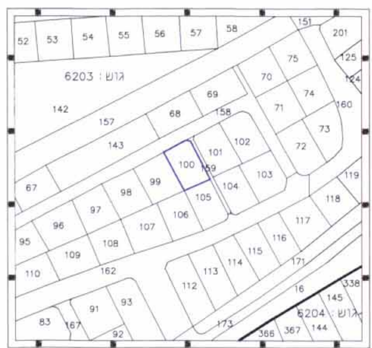
תרשים סביבה קנין 1:1250