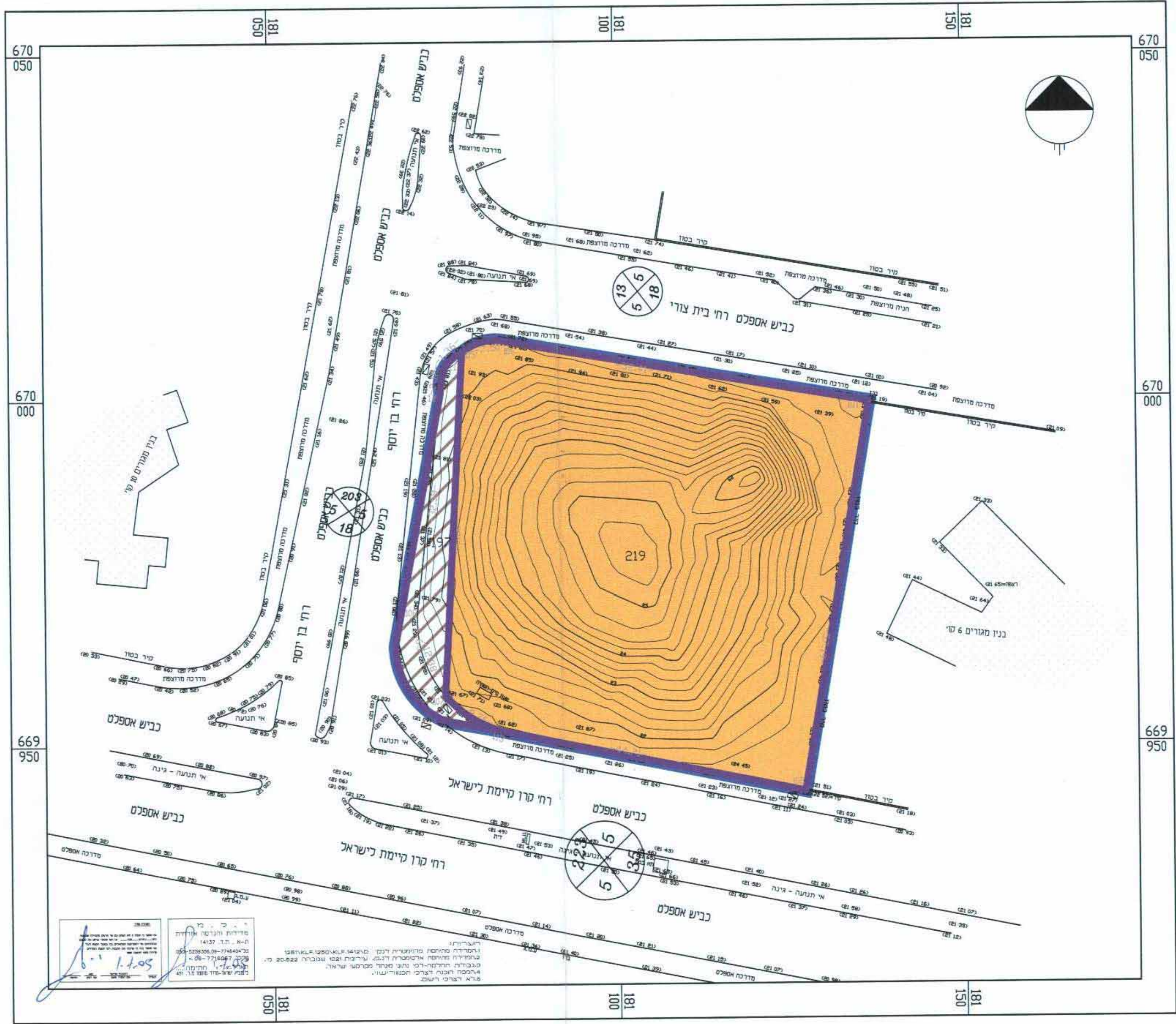
מצב מאושר קנה: 1:500