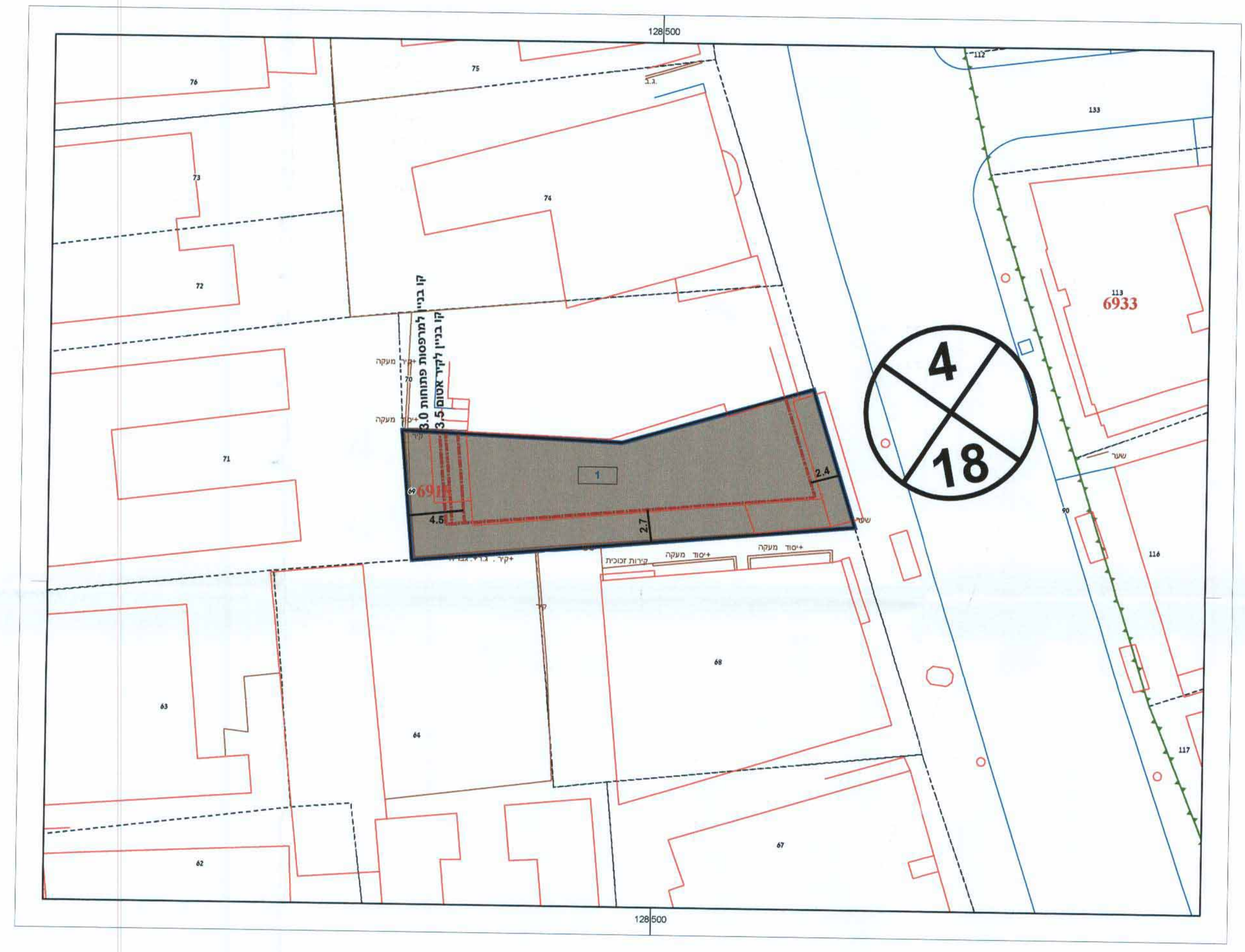
תוכנית מצב מוצע קנה מידה 1:250

מקרא מצב קיים דרך קיימת (*) אזור מסחרי (*) גבול תוכנית גושים חלקות (*) לא על פי מבאת