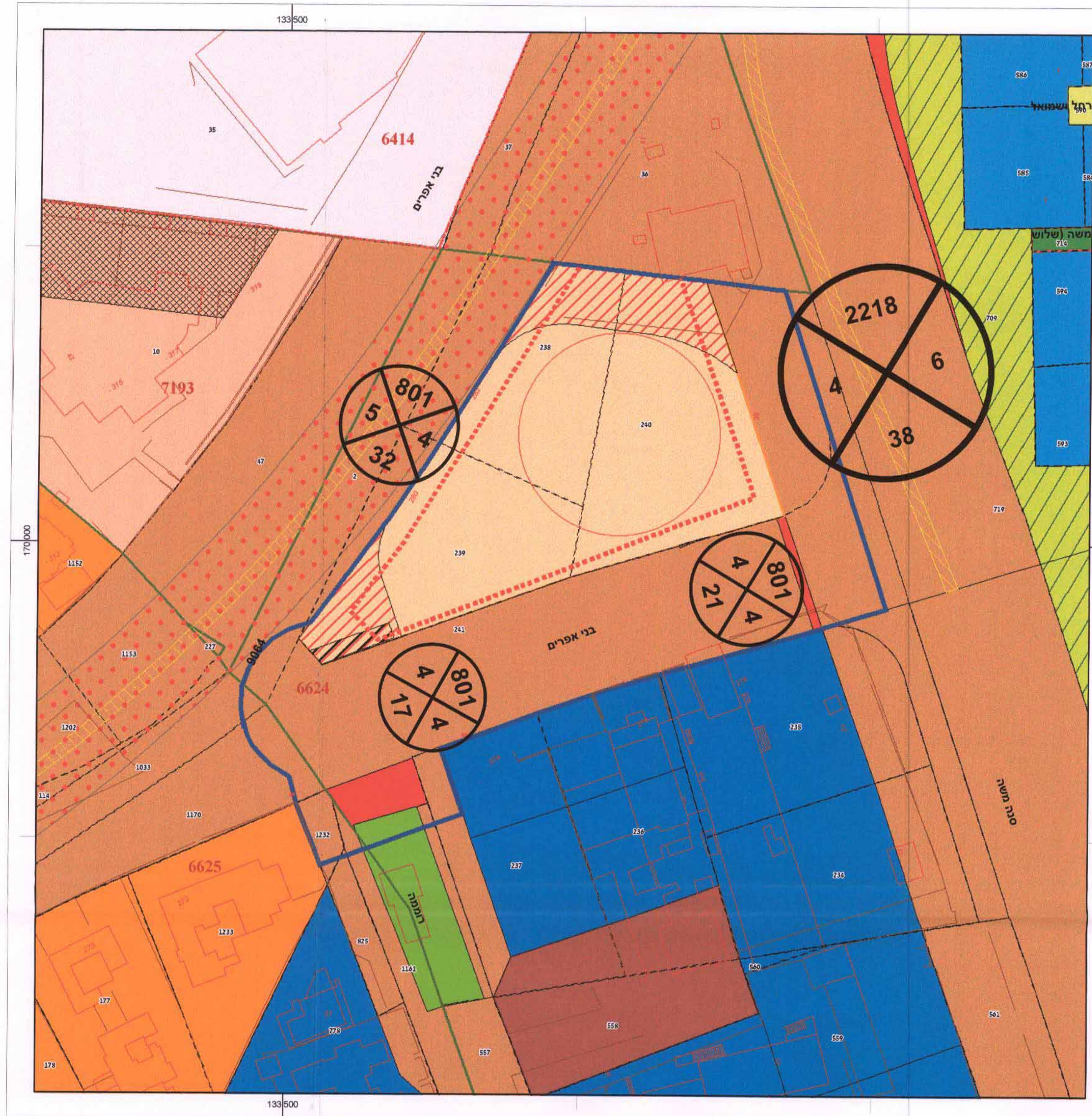
תוכנית מצב מאושר קנה מידה 1:500