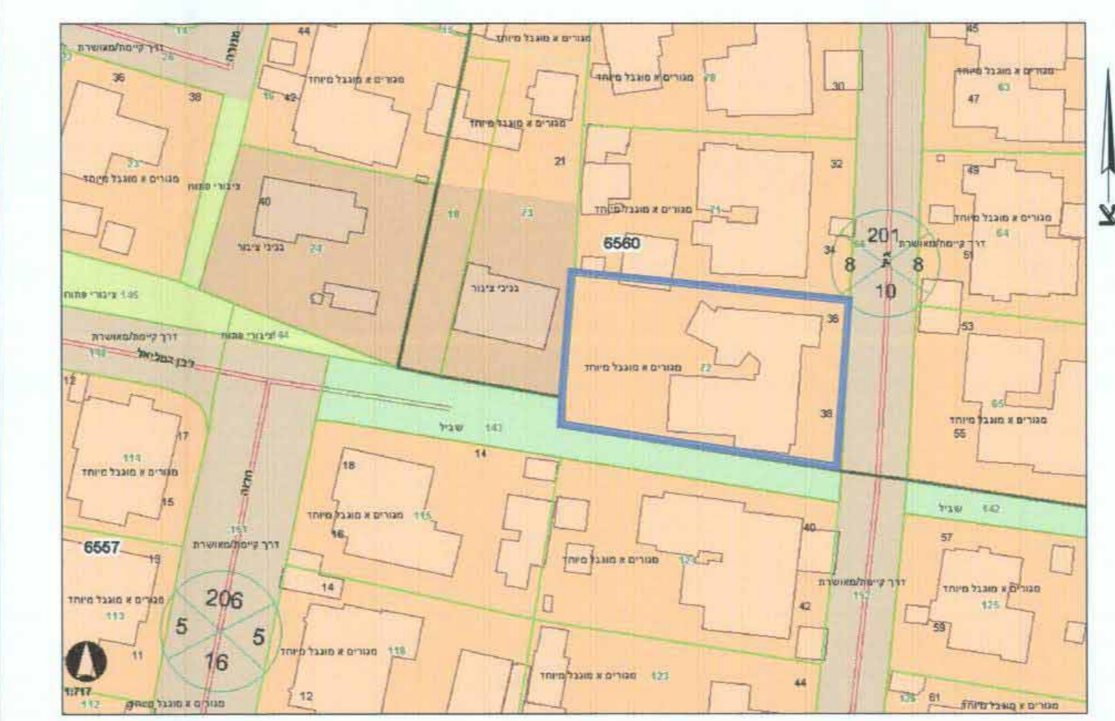
תרשים סביבה קרובה קנ"מ 1:1000