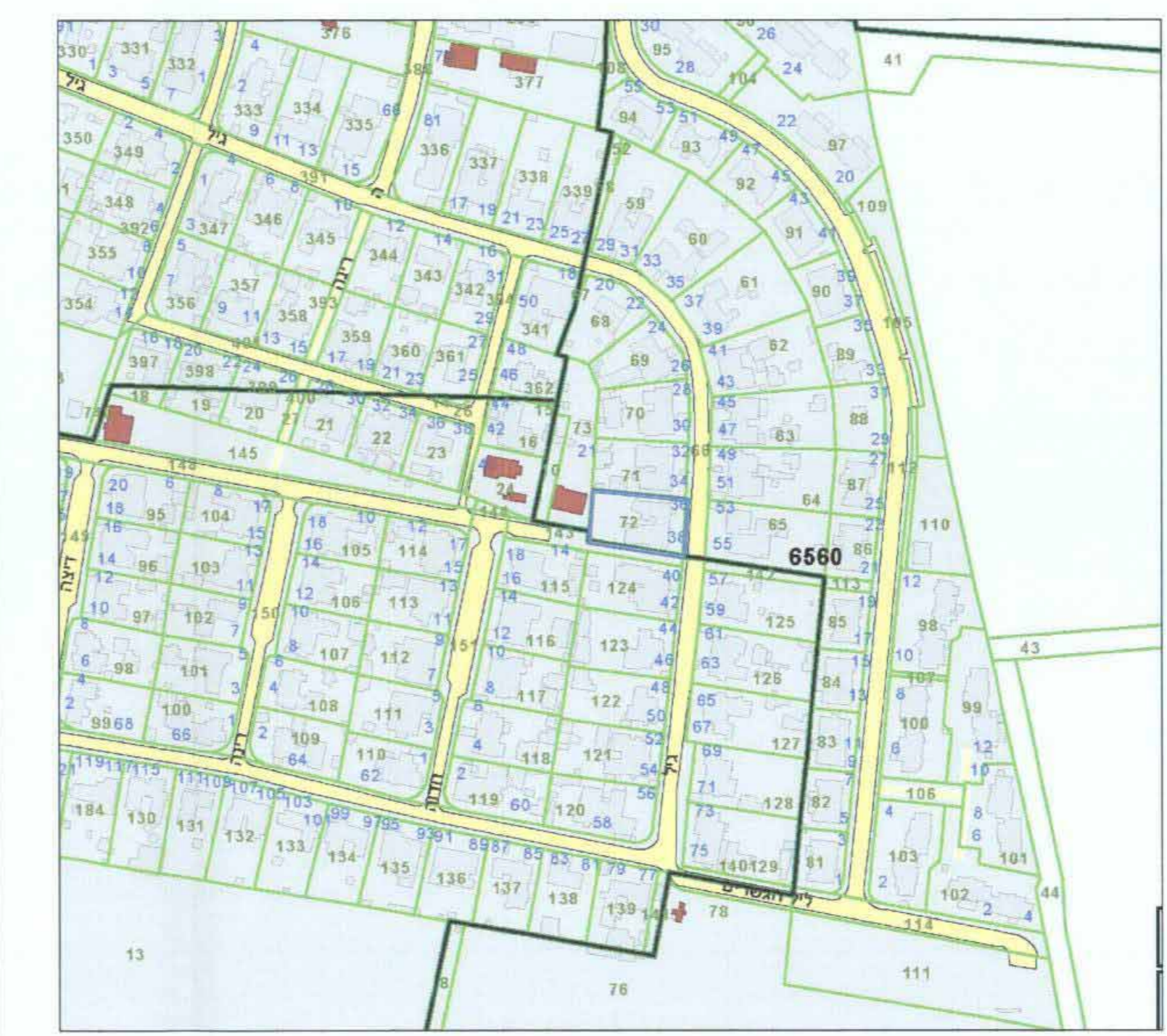
תרשים סביבה כללית קנ"מ 1:2500