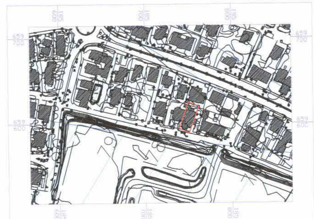
מגבלות ע"פ תמ"א 2/4 קני"מ 12500