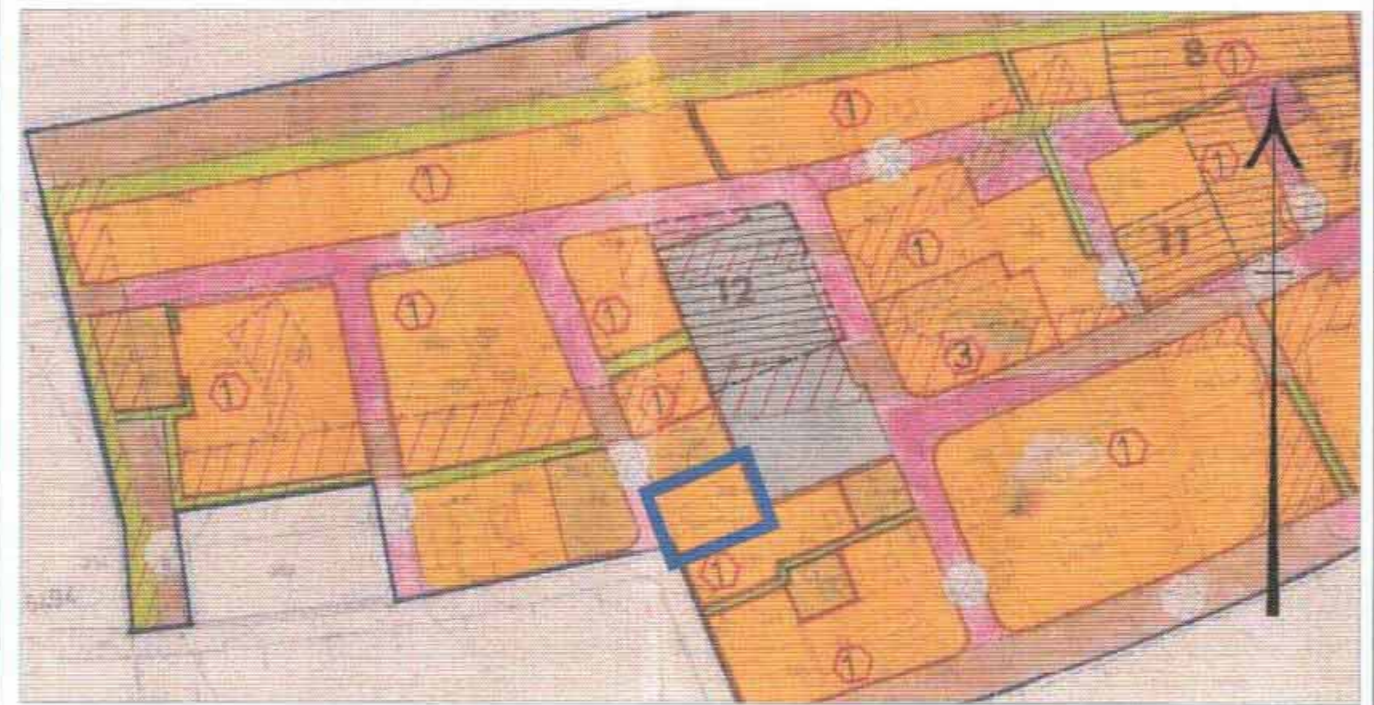
תרשים סביבה - תממ\195 קנ"מ 1:2,500