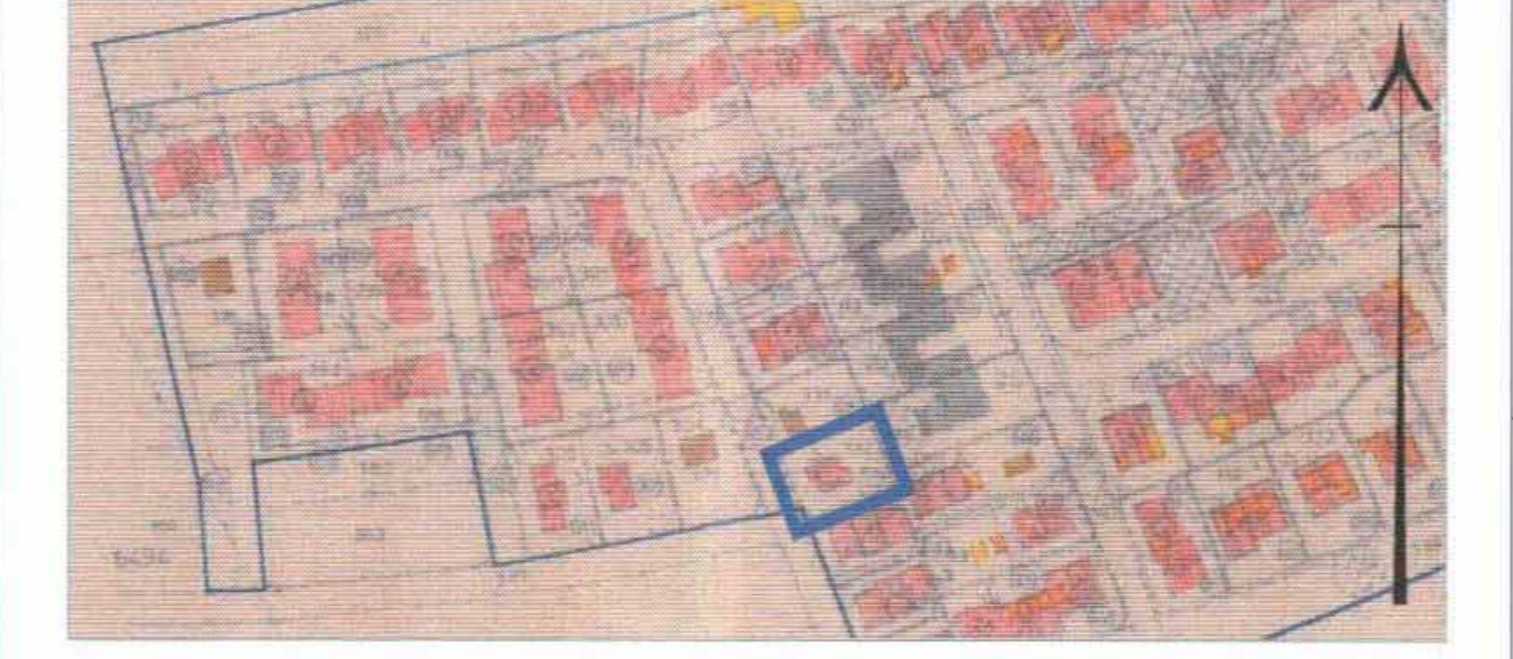
תשריט הבינוי - תממ\195 קנ"מ 1:2,500