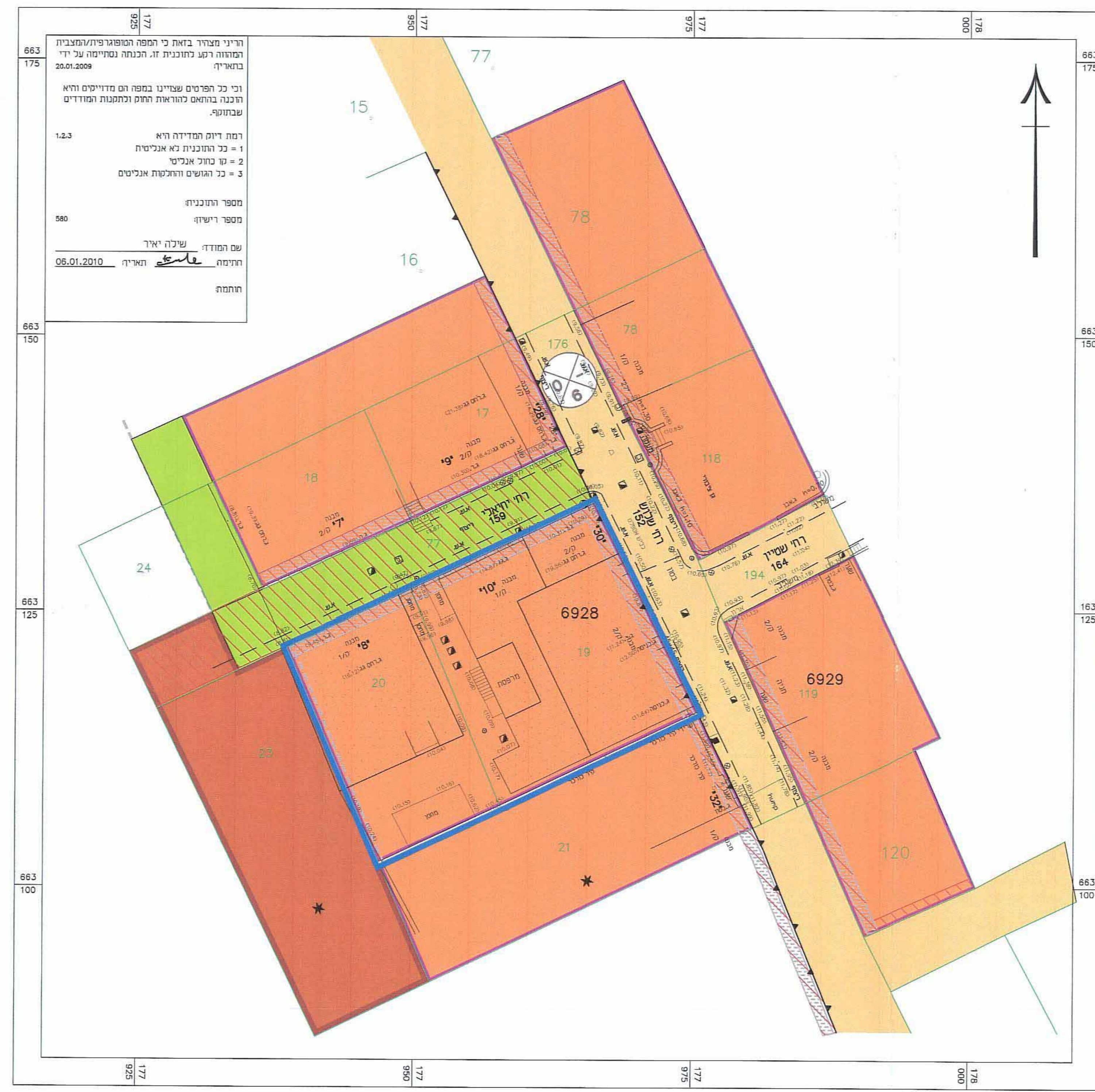
מצב מאושר קנ"מ 1:250