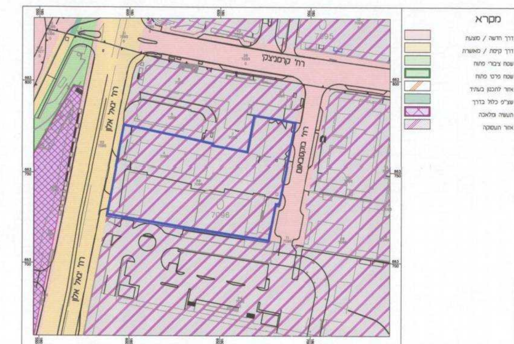
תרשים סביבה קרובה קנ"מ 1:1250