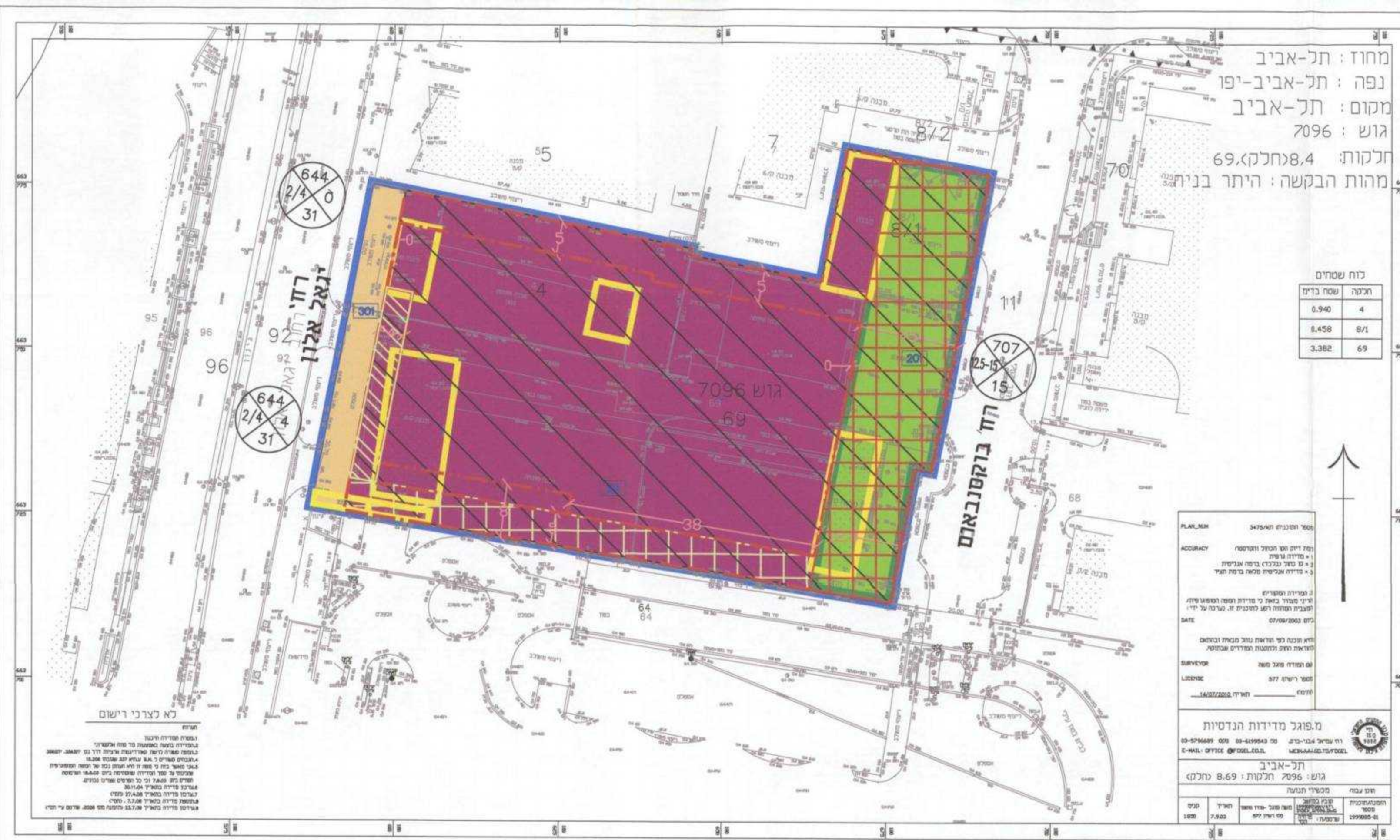
תכנית מצב מוצע קנ"מ 1:500

משרד הפנים מחוז תל-אביב חוק התכנון והבניה תשכ"ח-1968 אישור תכנית מס' תא/3475 הועדה המחוזית לתכנון ולבניה תל-אביב תאריך: 23.10.10 חתום: יפית ארזון