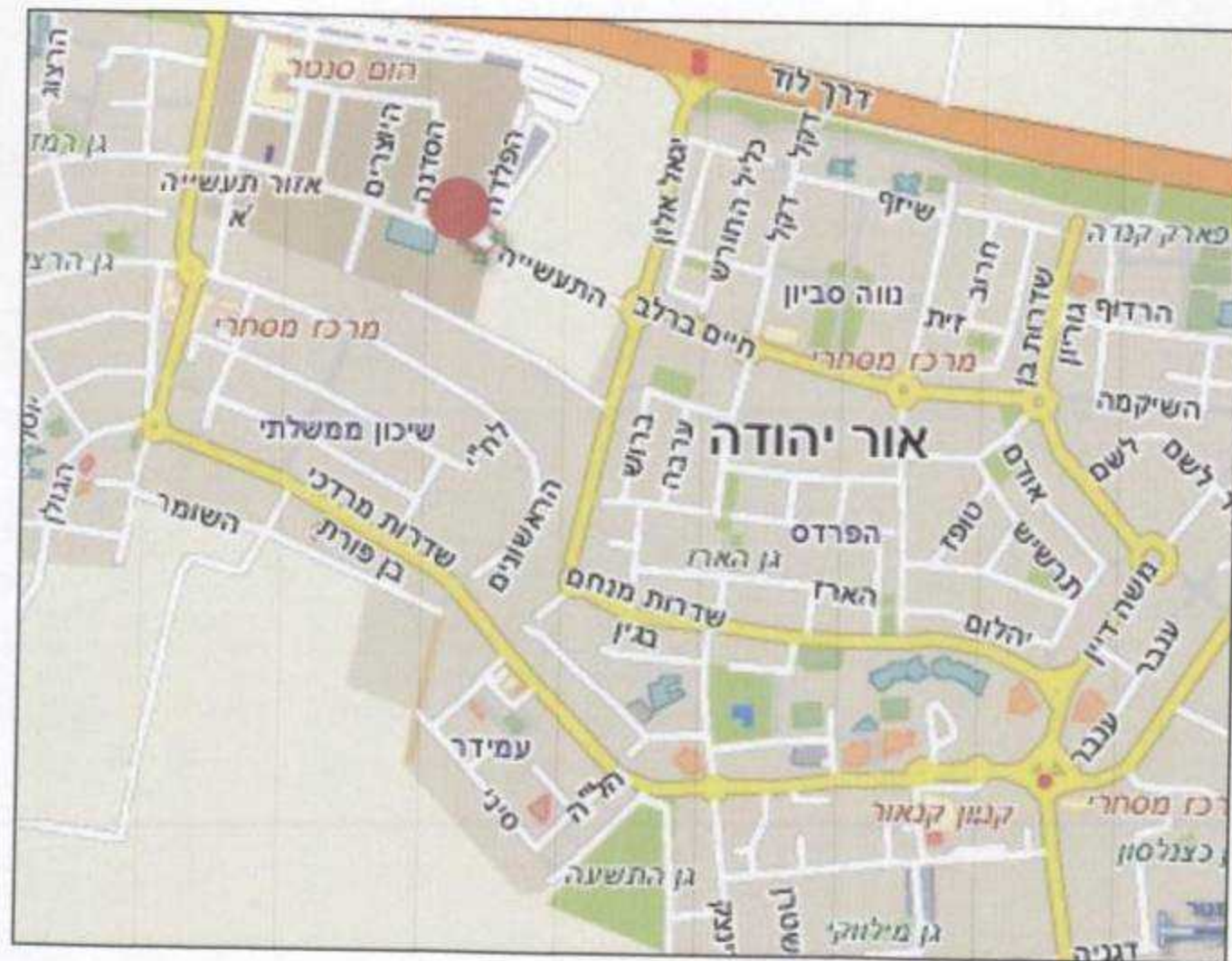
תרשים התמצאות כללית 1:10000