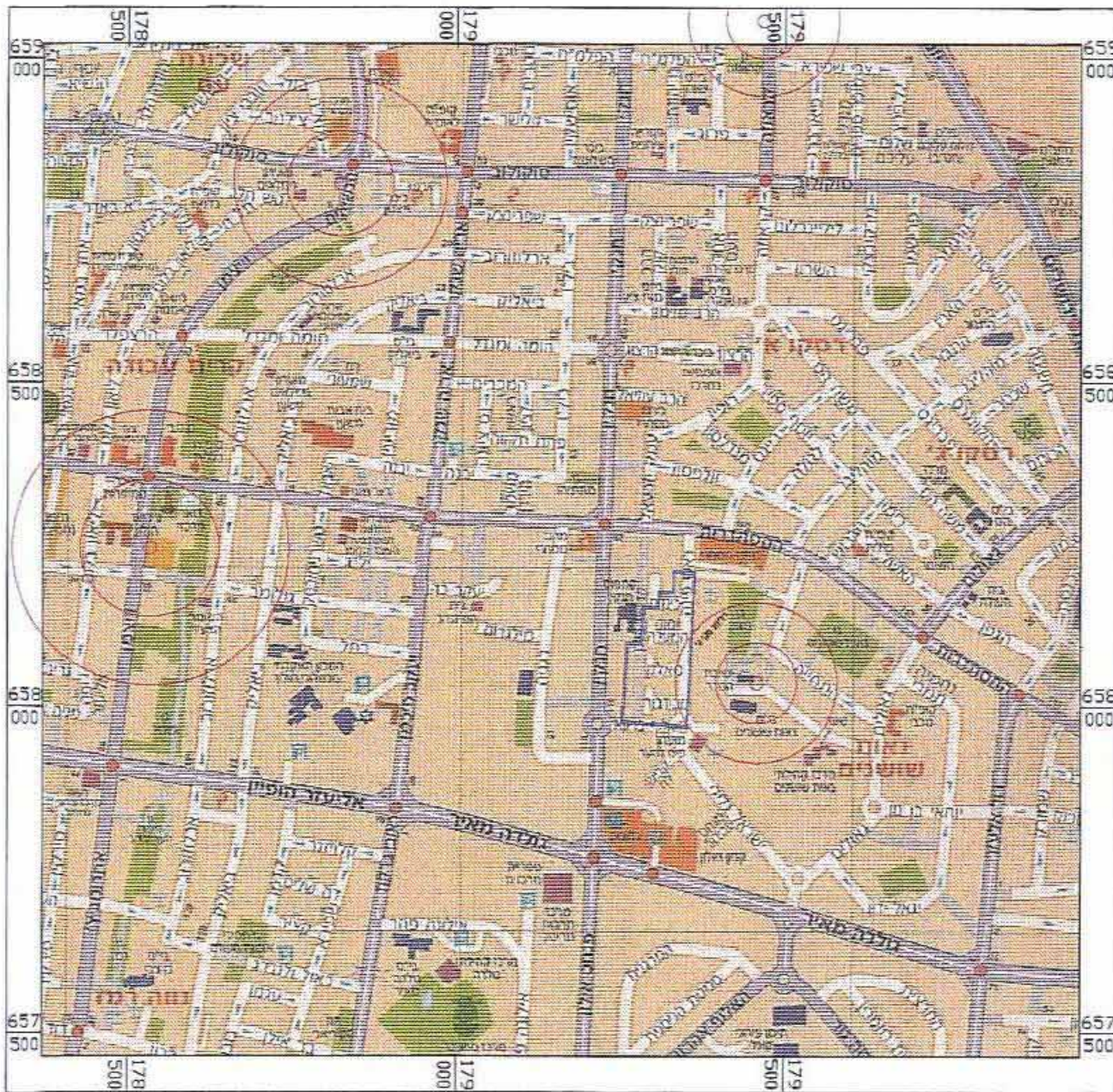
תרשים התמצאות כללית קנ"מ 1:10000

שלב: מילוי תנאים למתן תוקף מהדורה: 1 תאריך: 18.12.2011