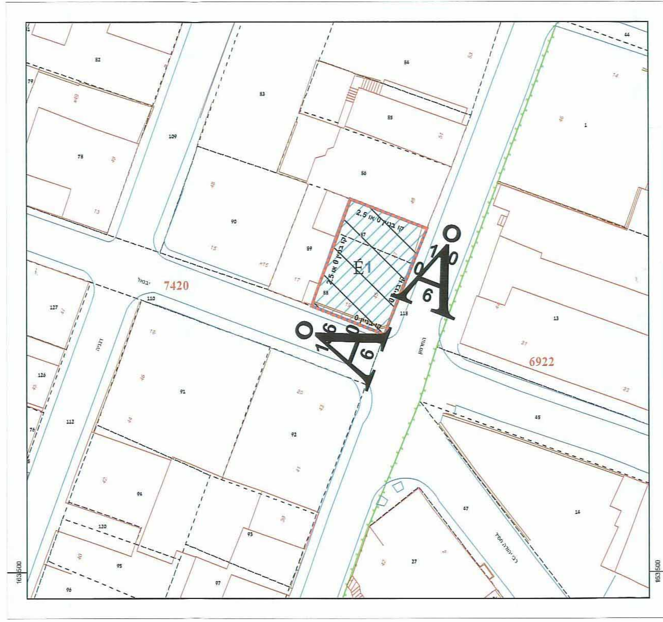
1:250 קנה מידה תוכנית מצב מאושר