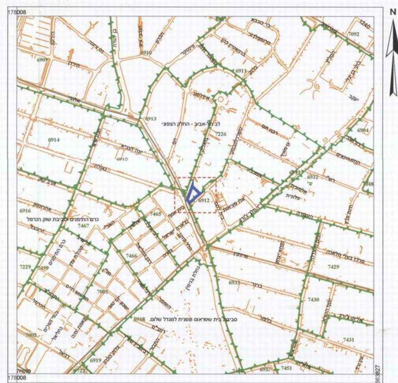
תרשים סביבה קנה מידה 1:5,000