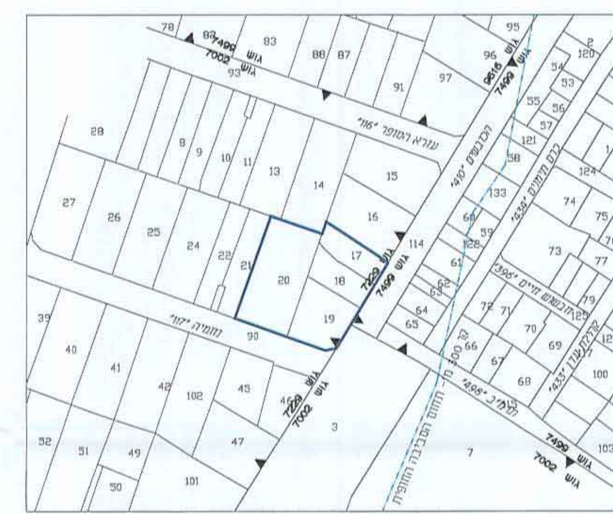
תרשים טביבה קני"מ 1:1250