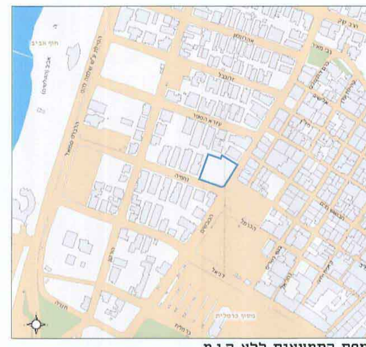
מפת התמצאות ללא ק.מ.