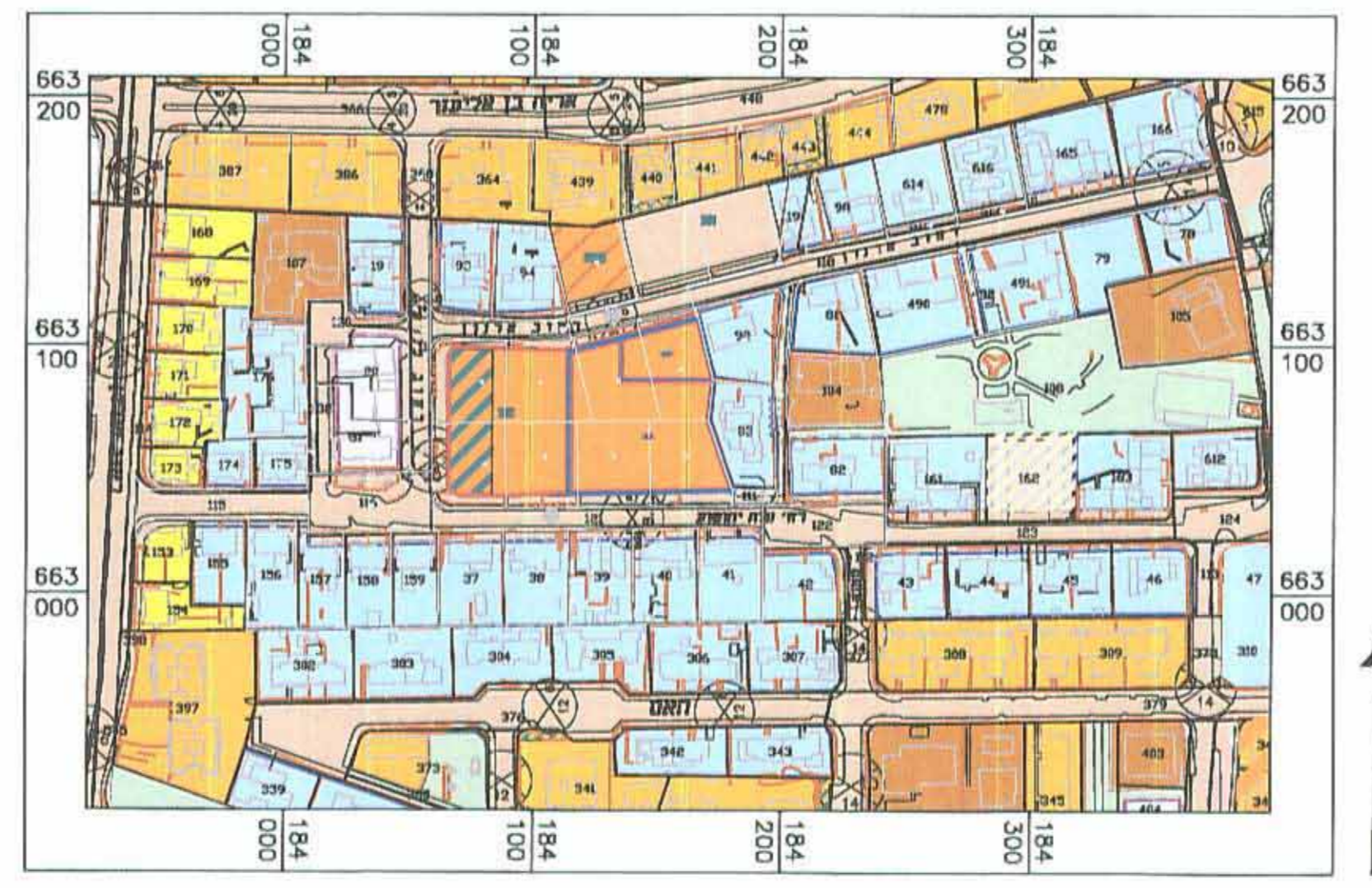
תרשים סביבה קרובה קנ"מ 1:2500