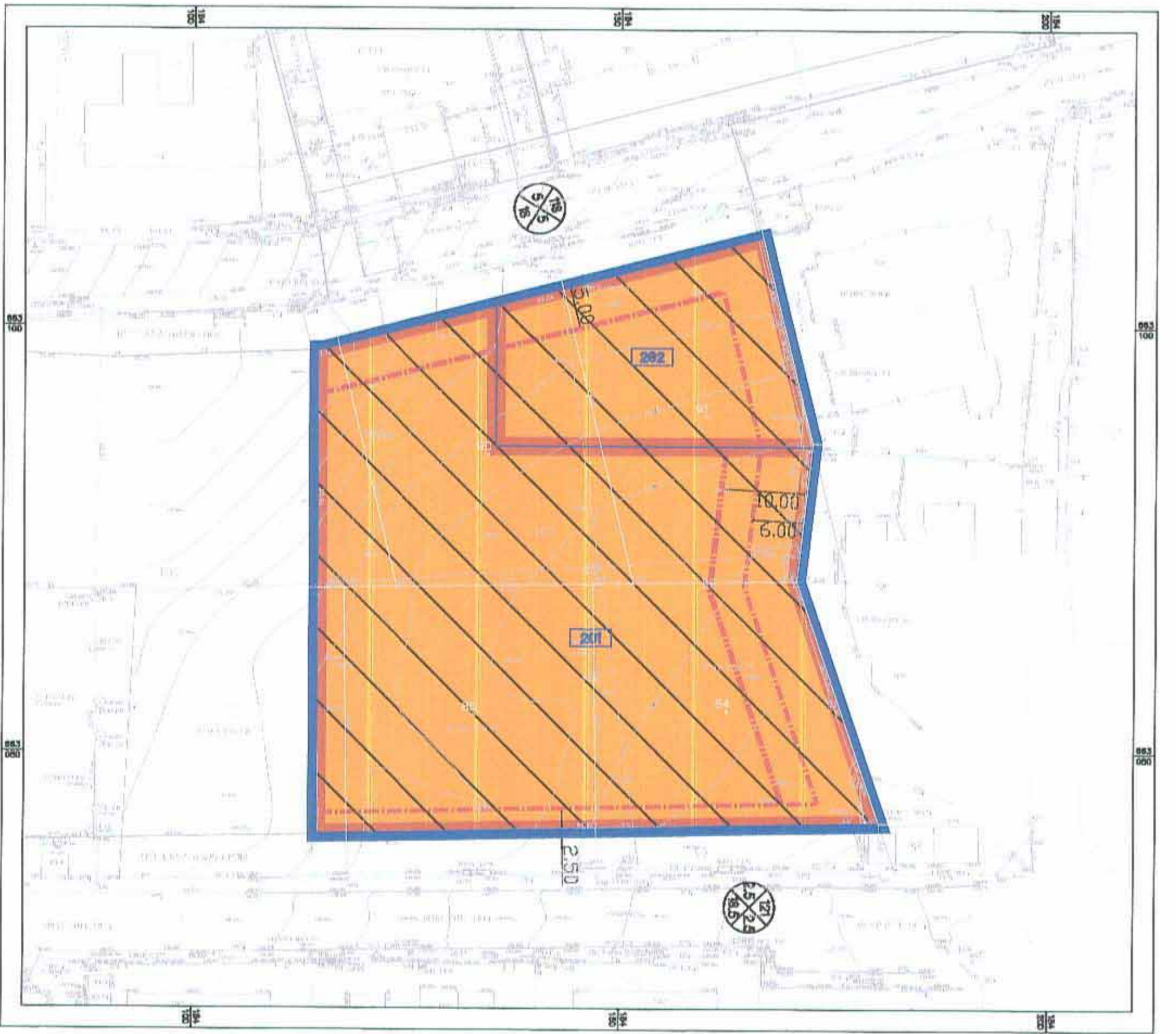
מצב מוצע קנ"מ 1:500