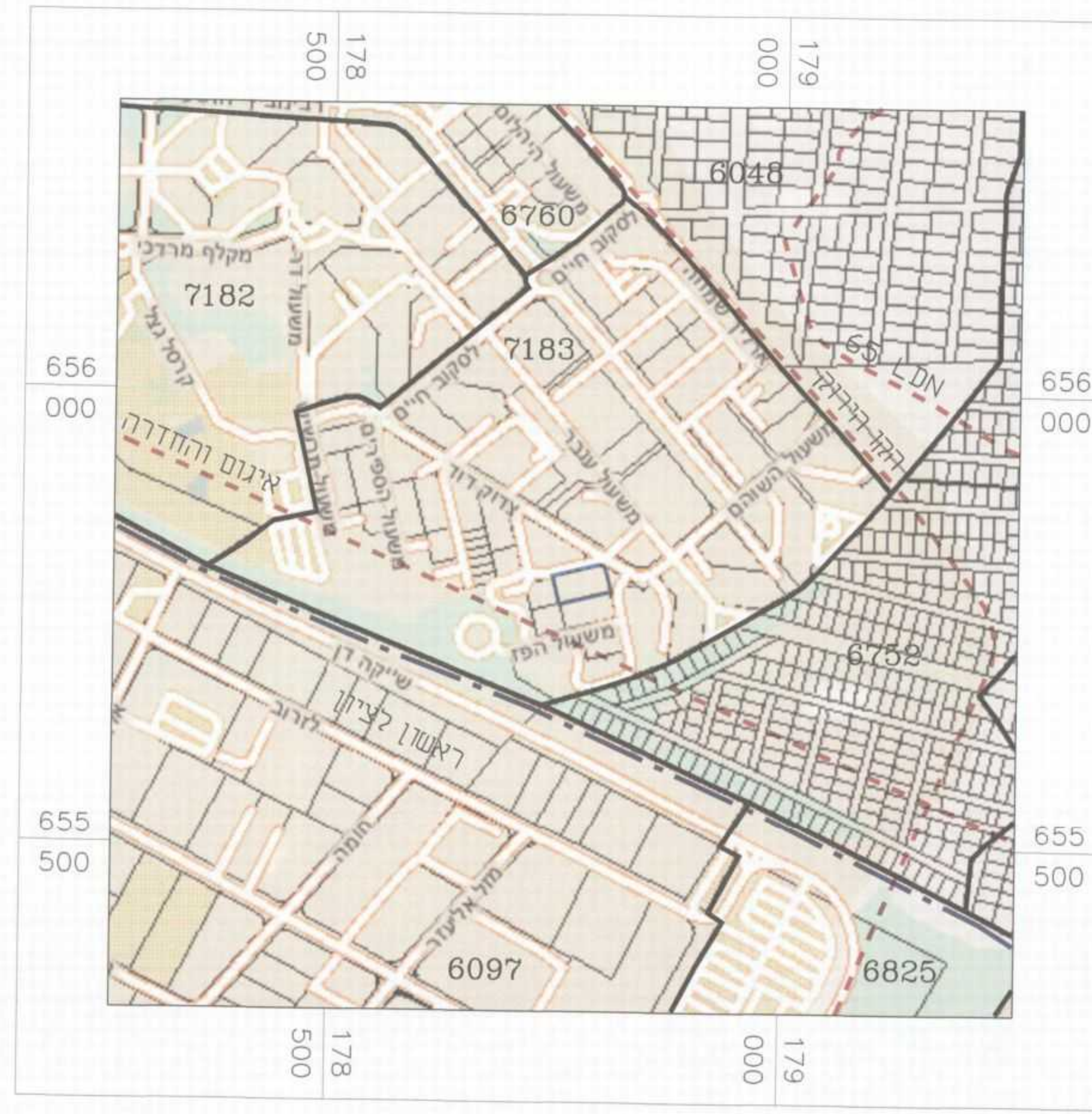
תרשים התמצאות קנ"מ 1:10000