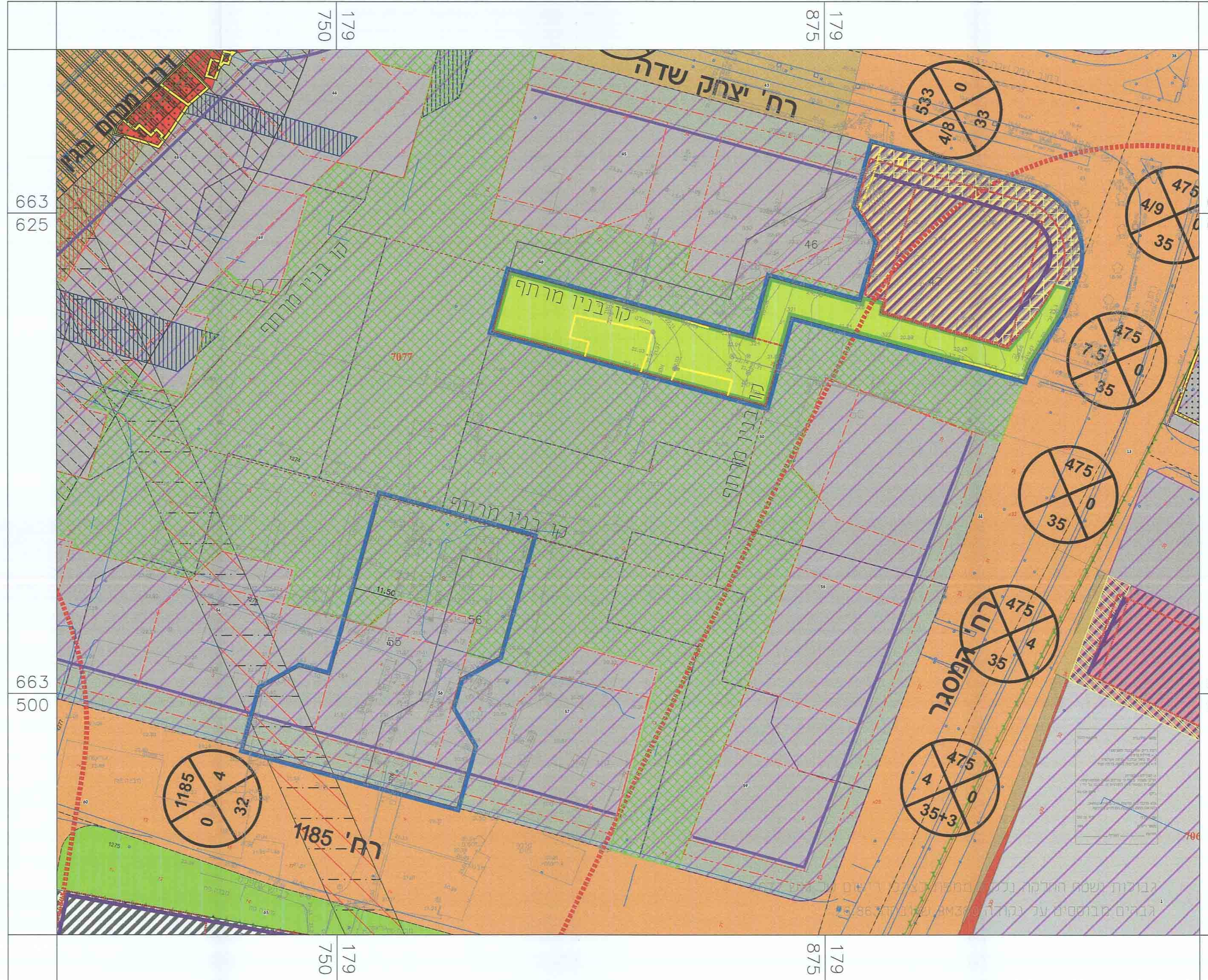
מצב מאושר ק.מ: 1:500