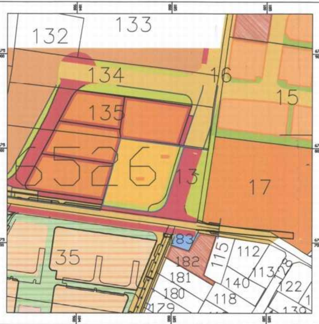
קומפילציה-מצב מאושר קנה 1:2500