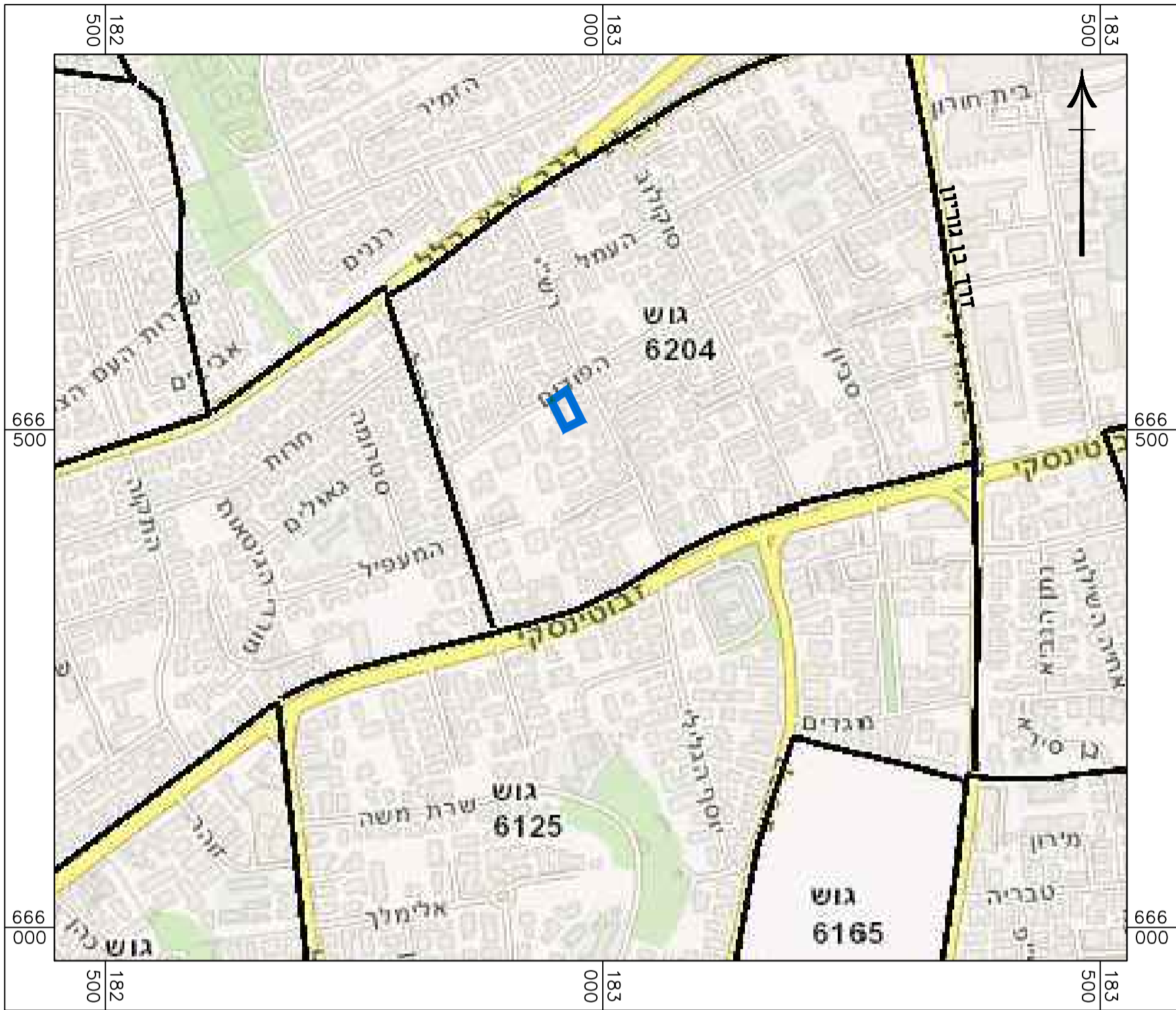
תרשים התמצאות קנ"מ 1:5000