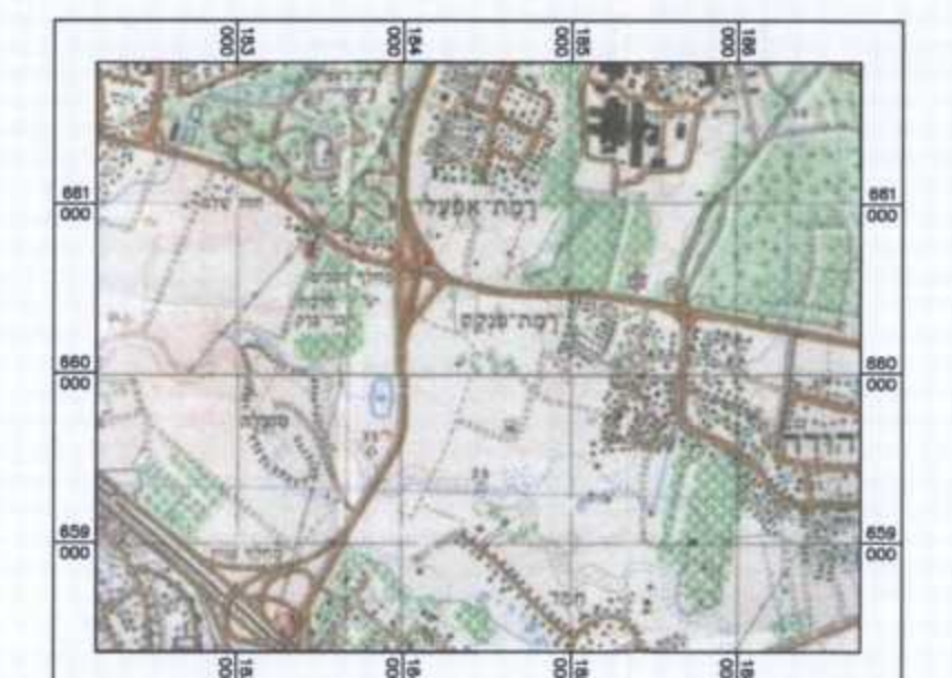
תרשים סביבה - קנימ 1:50,000