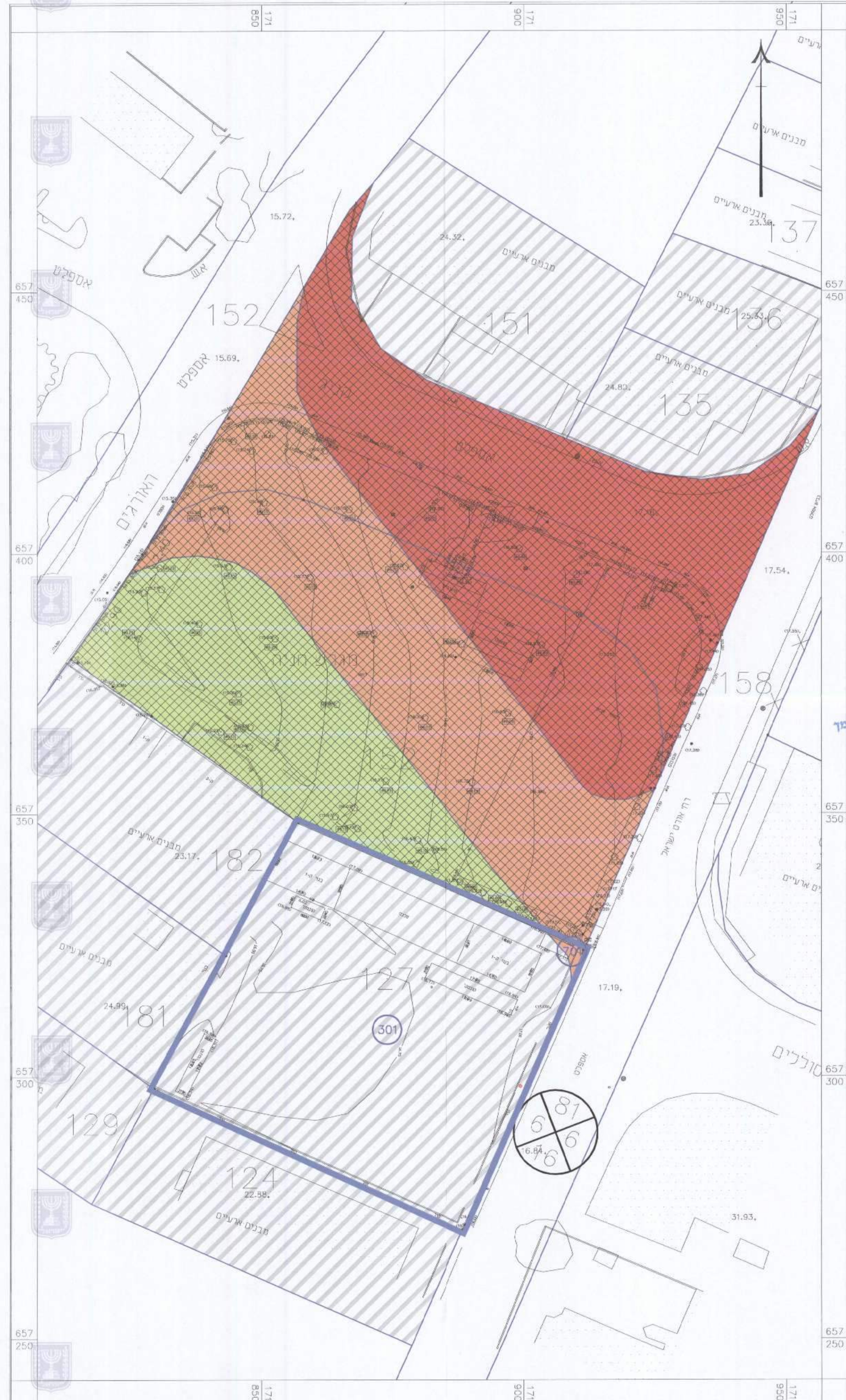
מצב מאושר 1:500

שם: מתן תוקף | גירסה: 7 | תאריך: 17.11.2016