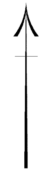
מפה טופוגרפית קני"מ 1:250

תל אביב תל אביב-יפו בת ים 7145 11 שטח : 1.518 ד' 148 שטח : 0.703 ד' 149 שטח : 0.812 ד' הוכן עבור: חברת מנרב מטרת התכנית: פינוי בינוי - בת ים