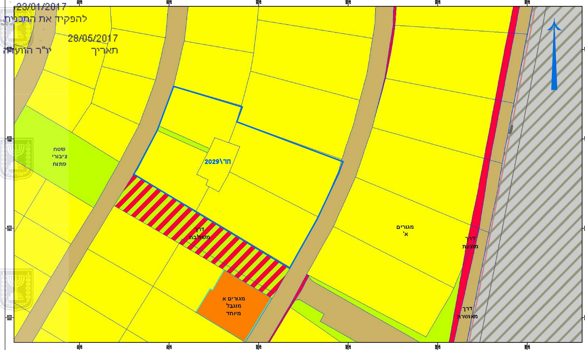
קנ"מ 1:1250 מצב מאושר הר' 2029